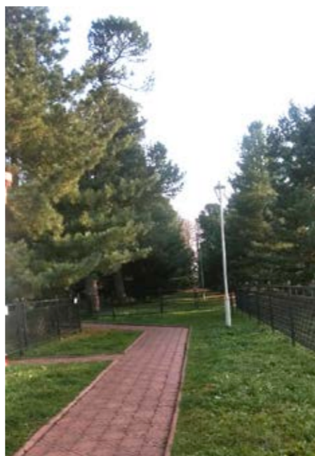
Святой кедровик у реки Волга, где в XIV веке митрополиту Трифону явилась икона Божьей Матери

или заново возведены каменные хозяйственные строения и кирпичные келейные здания, устроены овощехранилища, налажена работа трапезной, оборудован медицинский кабинет. «То, что казалось безвозвратно ушедшим, оживает вновь. Это чудо...», — можно прочитать в книге почетных гостей.