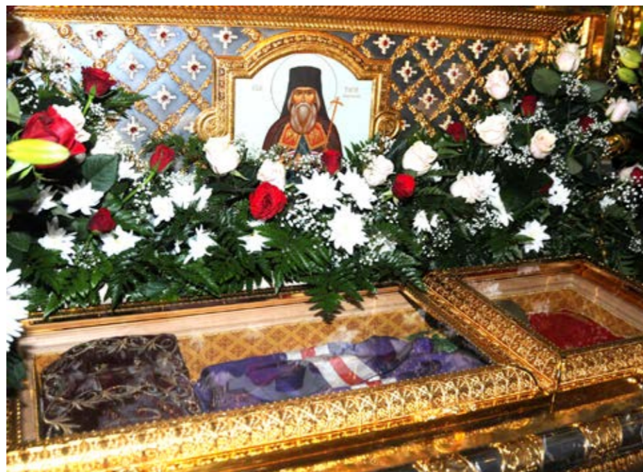
Мощи св. Игнатия Брянчанинова были обреты и перенесены в 1988 году в монастырь