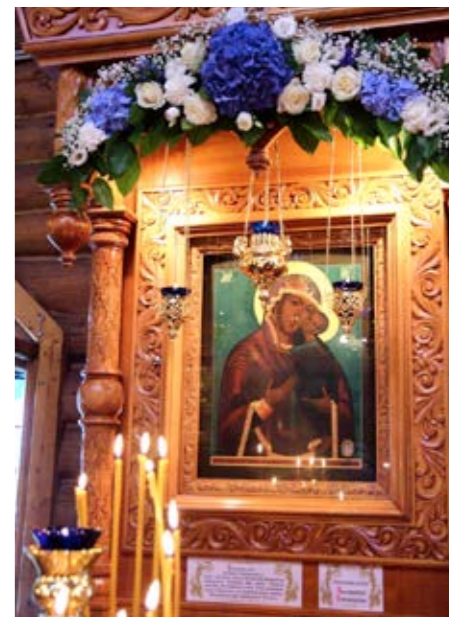
Чудотворная икона Божьей Матери

• Сведения о жизни обители после 1917 года скудны. В начале 30-х годов