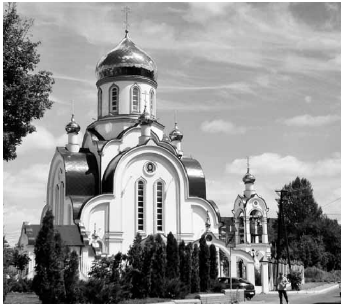
Храм Святых Царственных страстотерцев в г. Курске