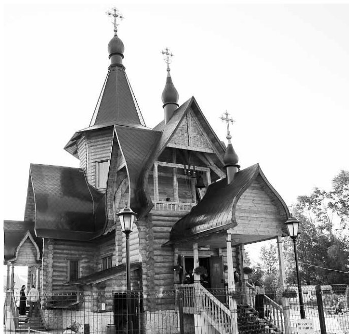
Храм Святых Царственных страстотерцев в п. Аляухово Одинцовского района Московской области

1 АВГУСТА — ДЕНЬ ОБРЕТЕНИЯ МОШЕЙ ПРП. СЕРАФИМА САРОВСКОГО