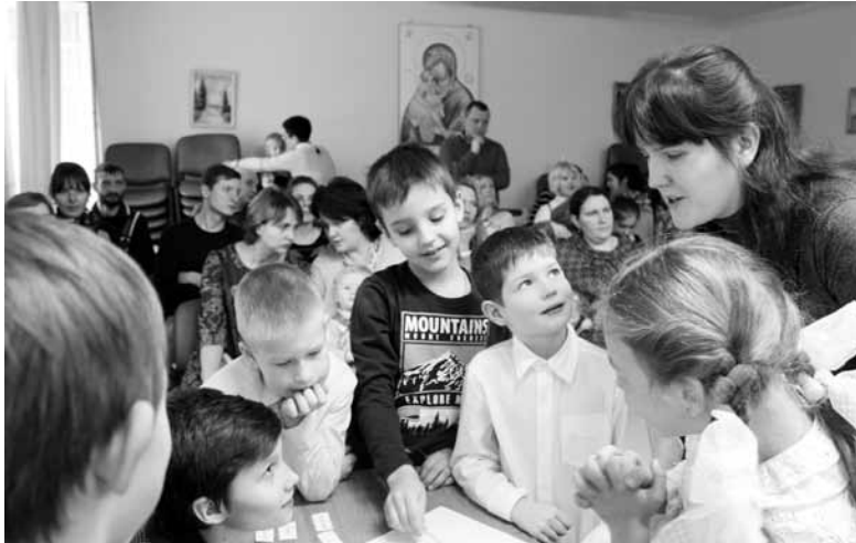
Рождественская викторина воспитанников воскресной школы. 25.12.2016