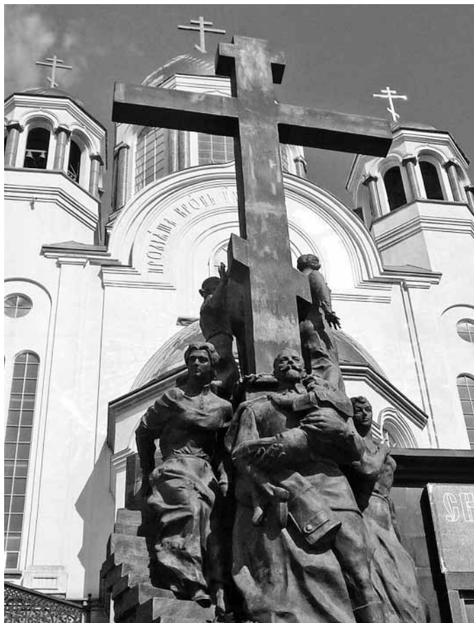
Памятник свв. страстотерцам в г. Екатеринбурге

17 ИЮЛЯ — ДЕНЬ ЦАРСТВЕННЫХ СТРАСТОТЕРПЦЕВ