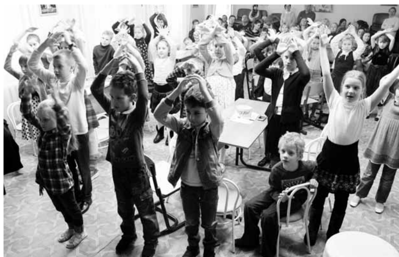
Рождественская викторина воспитанников воскресной школы. 25.12.2016