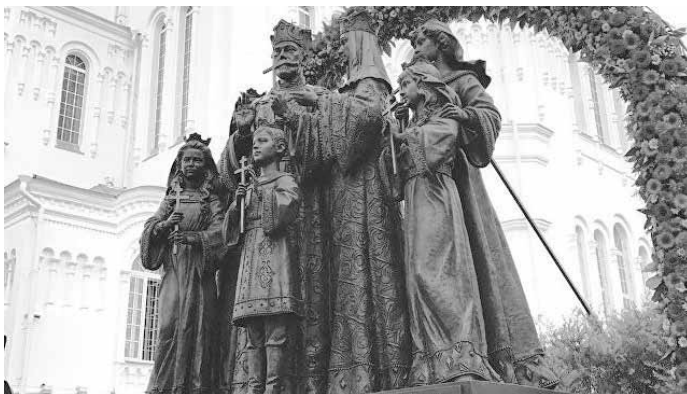
В Дивеево 31.07.2017 был открыт памятник Царской семье

1 АВГУСТА — ДЕНЬ ОБРЕТЕНИЯ МОШЕЙ ПРП. СЕРАФИМА САРОВСКОГО