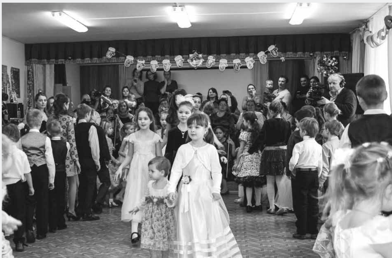
25 января 2015 года музыкальная студия "Скерцино" отметила свой 10-летний юбилей Детским балом