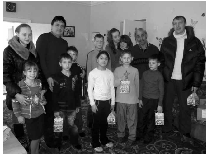
В детском приюте "Росинка" 23.02.2012

На постоянной основе в течение года оказывалась помощь в обеспечении одеждой малоимущих и многодетных семей Мытищинского, Сергиево-Посадского, Балашихинского и Александровского районов. Более 100 семей получили помощь. Была направлена одежда детям в приюты благотворительной организации «Город надежды». Организован сбор помощи пострадавшим от наводнения в Краснодарском крае.