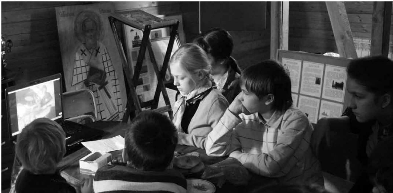
На занятии с воспитанниками приюта «Преображение»

В последнее время часто приходится сталкиваться с тем, что люди теряются и не знают, как можно реализовать евангельский призыв к милосердию и, если говорить более конкретно, призыв творить милостыню. И действительно, в наше время сложно не растеряться, когда люди просят буквально на каждом шагу. В связи с этим было бы полезно напомнить некоторые принципы, которые помогут решить эту задачу.