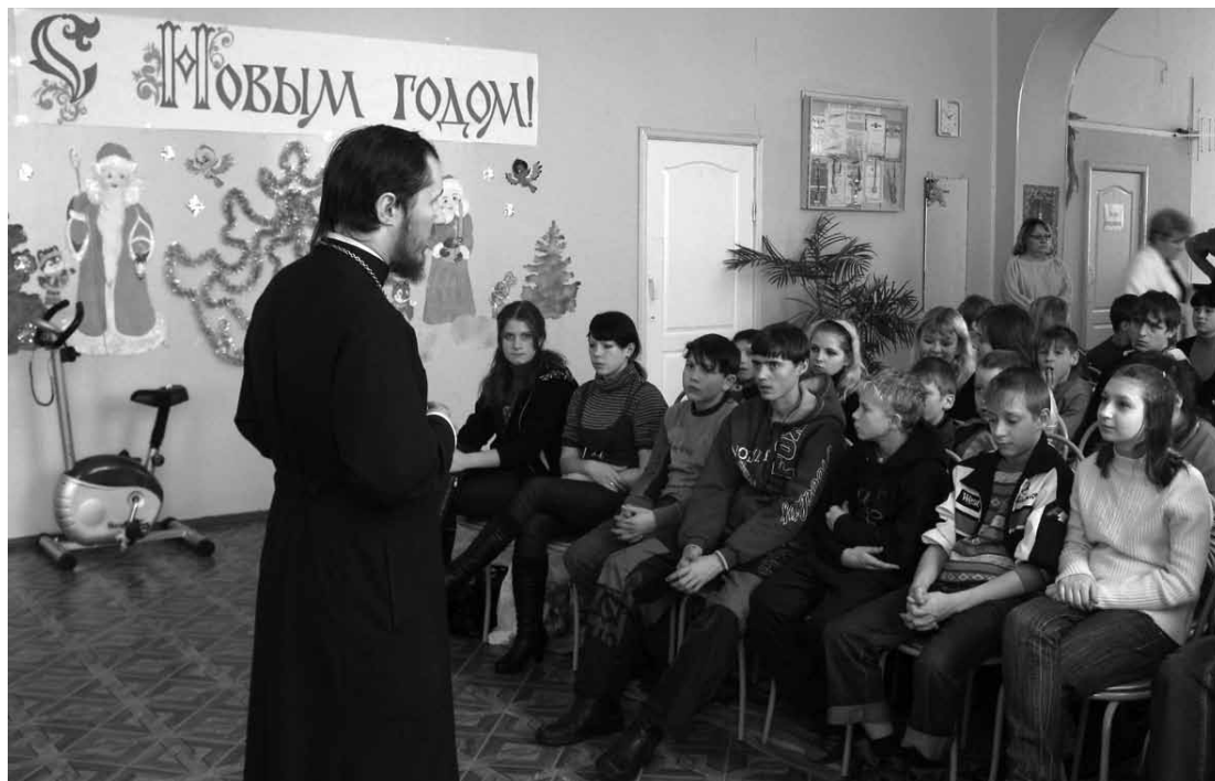
Рождество в Белоомуте 2010 год