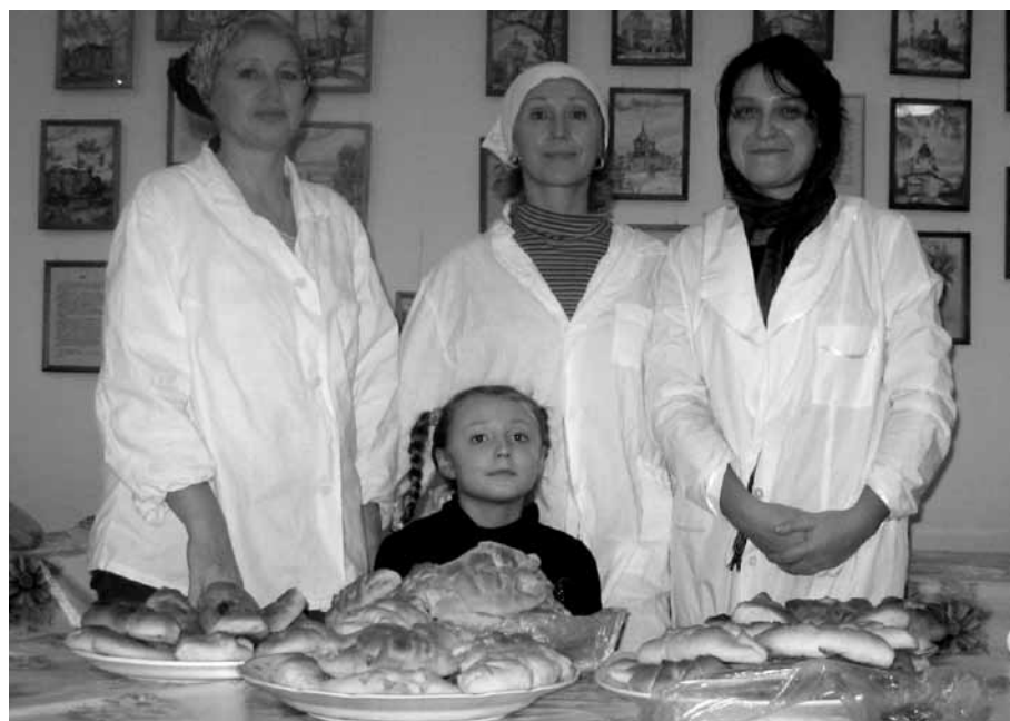
Волонтеры в помощь акции «Согреем детские сердца».

По окончании праздника всех ждали накрытые праздничные столы и подарки для каждого участника праздника. Не только традиционные сладости, но и замечательные вкусные пирожки, испеченные руками работников трапезной и прихожан, смогли подарить детям еще частичку доброты и тепла, которая поможет им идти в жизни верной дорогой — дорогой добра.