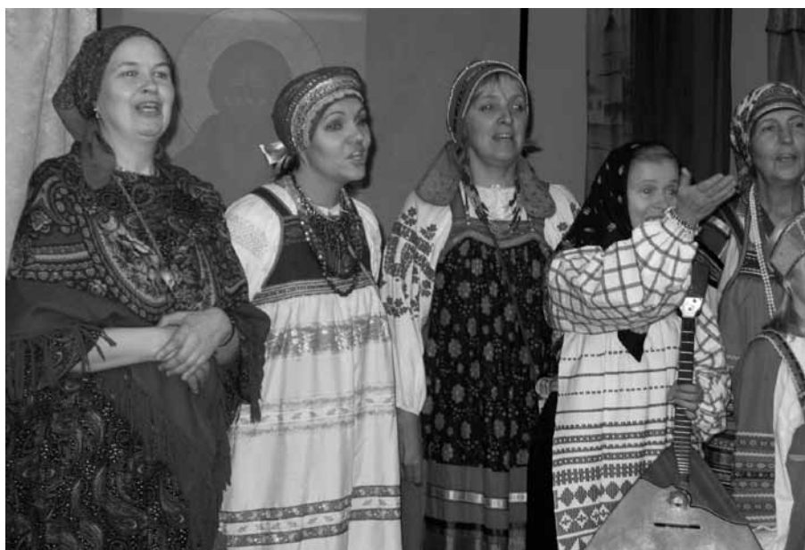
Ансамбль «Донская слободка»