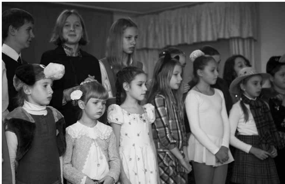
Музыкальная студия «Скерцино» на сцене

Песня «Нарисую этот мир» стала подарком всем юным гостям праздника: