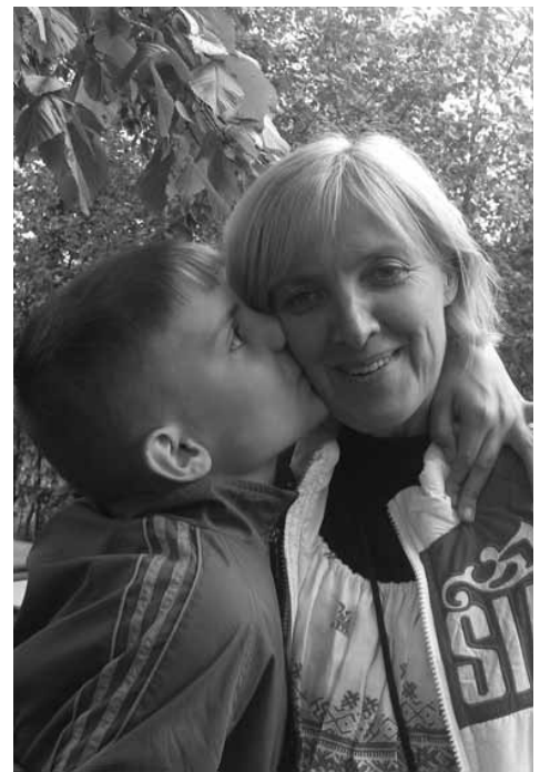
На природе с воспитанниками интерната г.Белоомут