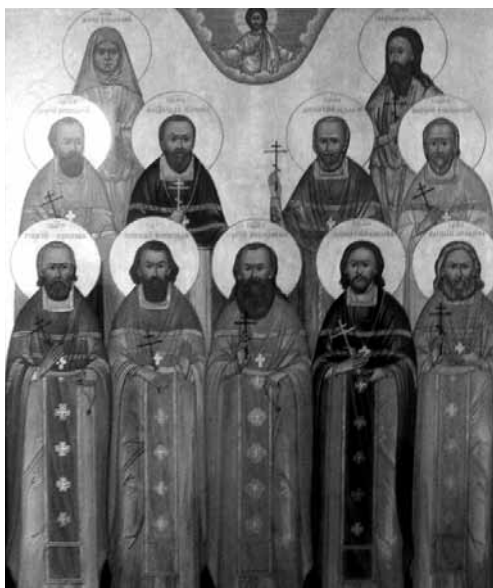
Икона святых, пострадавших за веру на Бутовском полигоне 27 ноября 1937 г. Храм Воскресения Христова на Бутовском полигоне. В нижнем ряду слева — свщч. Георгий Извеков

А храм, тот самый, Донской, где служил он в самые страшные для Церкви годы, ждет своего неизбежного возрождения и воскресения. Это обязательно случится. Аминь.