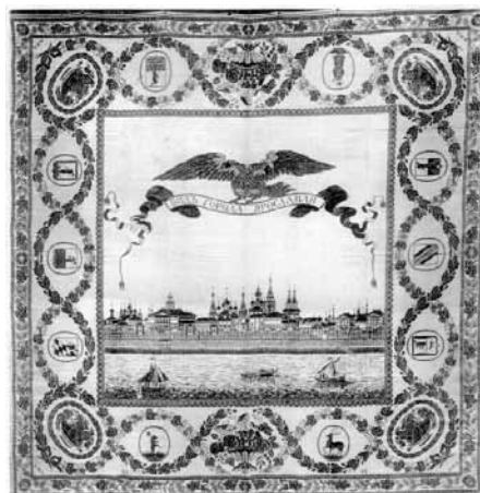
Скатерть работы Ярославской Большой мануфактуры с видом фабрики