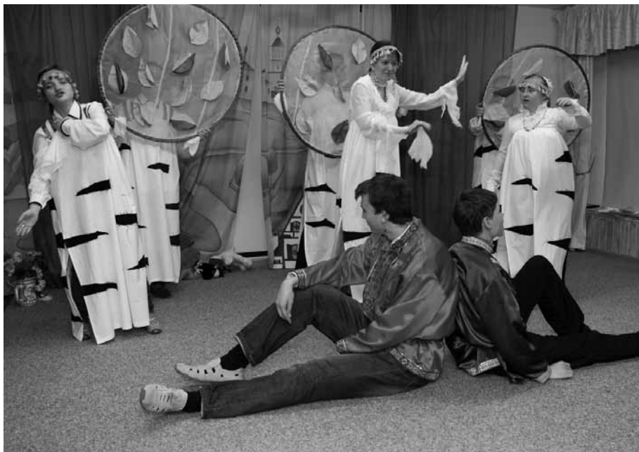
Выступление социально-реабилитационного центра «Мечта»

Детской музыкальной студией «Скерцино», действующей при Донском храме, был показан мюзикл М. Дунаевского «Мэри Поппинс» и подготовлен праздник для маленьких зрителей. В этот день гостями духовно-просветительского центра в Перловке стали воспитанники социального приюта для детей и подростков «Преображение»