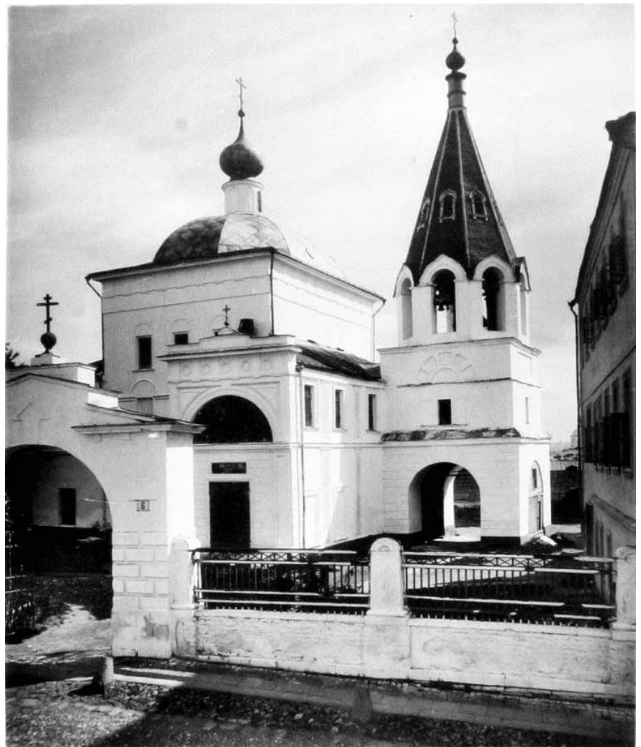
Церковь Трех Святителей на Кулишках 1881 год.