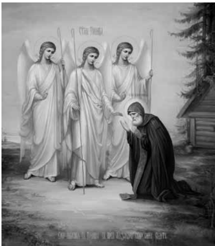
Явление Святой Троицы Александру Свирскому

И вот, наконец, мы отправились на поезде «Москва-Петрозаводск» к прп. отцу Александру. В поезде мы разговаривали на разные темы, шутили, смеялись. Утром мы стали готовиться к встрече с благодатью: прочли утренние молитвы. Прибыв на станцию «Лодейное поле», мы направились напрямик в монастырь. На улице было прохладно, а на душе очень волнительно. В монастыре нам очень повезло: в храме была открыта рака с мощами святого преподобного