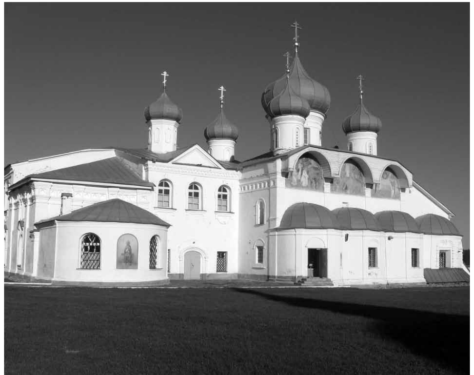
Преображенский собор Свято-Троицкого Александрo-Свирского монастыря

После службы мы зашли в часовню, которая была построена на месте явления Святой Троицы прп. Александру Свирскому. Когда находишься в таком святом месте, то удивляешься тому высокому достоинству, которое было даровано Богом человеку, и это соприкосновение Бога с человеком становится реальностью.