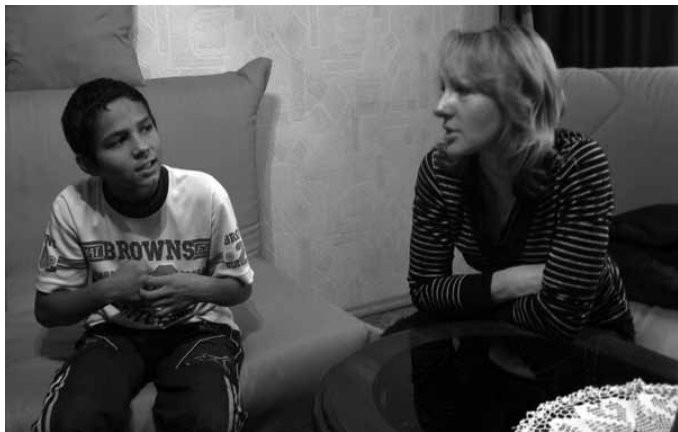
В приюте «Преображение»

детские дома и приюты, опекаемые нашим храмом, снабжаются художественными предметами интерьера, обувью, игрушками, канцтоварами, мебелью, предметами быта. Важной становится помощь в лечении детей и приобретении медикаментов. Инициативная группа находится в постоянном контакте с руководством детских учреждений, выявляя текущие потребности. Периодически проводятся приходские акции по сбору необходимых средств, обычно — это сбор помощи для детей-сирот «Готовимся к школе», а также аналогичные зимняя Рождественская и весенняя Пасхальная акции.