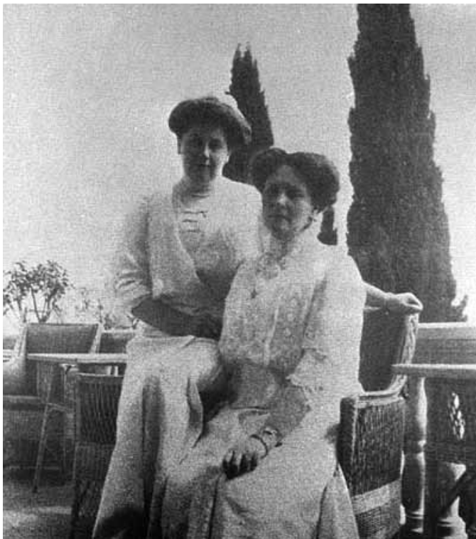
Императрица Александра Федоровна и фрейлина Анна Вырубова в Ливадии

армейской службы сына Распутина. Чтобы почувствовать нормальность в отношениях царственных супругов (отсутствие какого-либо «нажима» со стороны Государыни и отсутствие «податливости» со стороны Государя), а также нормальность и в отношении Государыни к Распутину (отсутствие какой-либо экзальтации), стоит познакомиться с письмами Царицы мужу, например, с письмом, написанным 17 декабря 1916 года, после известия о том, что Григорий Ефимович исчез. Об этой тревожной новости Государыня пишет сразу после вопроса о здоровье «Бэби» (Алексея Николаевича) и следующей за ним шутки: «Он начнет толстеть и больше не будет таким прозрачным — милый мальчик!». Далее следует рассказ о том, что ей стало известно в связи с исчезновением Распутина, что есть подозрение и насчет убийства (не хотела верить), какие-то конкретные подробности — все, что могла Государыня сообщить на тот момент. Изложено просто, трезво и ясно, и это при сильнейшей тревоге за дорогого ей человека. Никакой экзальтации, никакой пресловутой истерии.