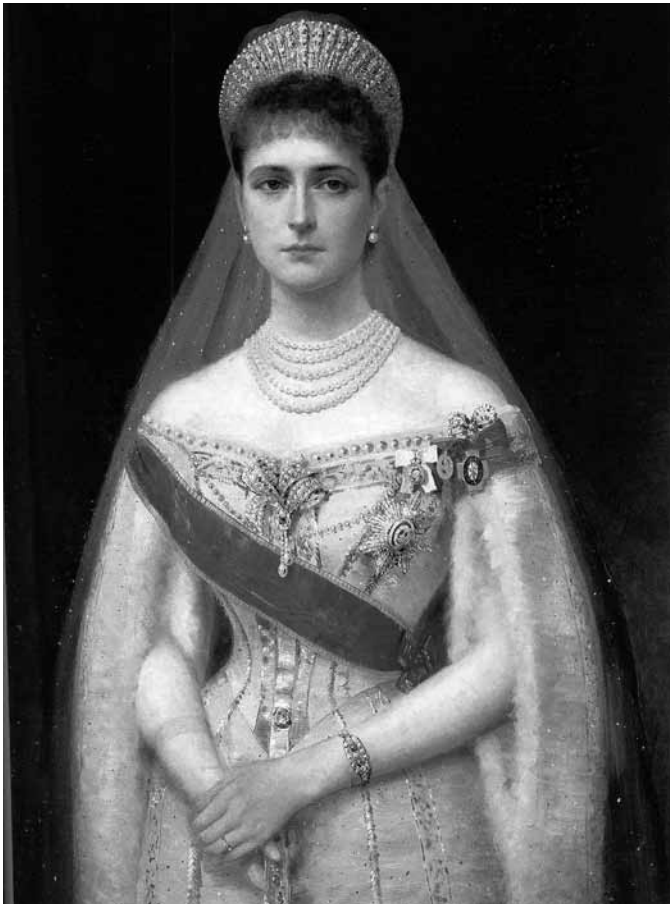
Портрет императрицы Александры Федоровны И. С. Галкин

Царицу-мученицу Александру Федоровну зачастую, просто сказать, не любят. Умудряются признать за ней святость — канонизированность в разряде страстотерпцев — и оставаться при стереотипах столетней давности: дурно, мол, влияла на царя, была истеричкой и ретроградкой и так далее. Погубила Россию — так по-прежнему считают и многие православные! Не ведают, что думают. Ибо все это просто какая-то накипь сознания, восходящая к сознанию тех, кто предал и императора, и Россию. От этого можно отрешиться, примеры имеются, и поэтому можно надеяться, что клевета залезет под плитку. В день рождения Государыни (она родилась 25 мая 1872 года) хочется вспомнить о ней правдиво.