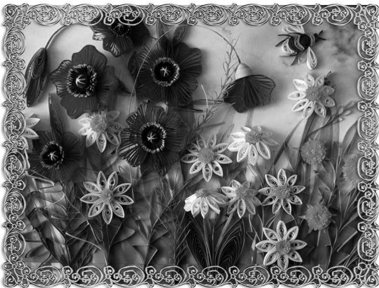
Цветочная композиция выполнена воспитанниками детского центра «Росинка» г.Ростов в технике квиллинг