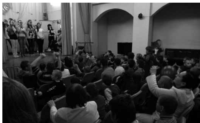
Концерт в детском доме-интернате «Березка»

Подготовкой концертов для «золотого возраста» (как