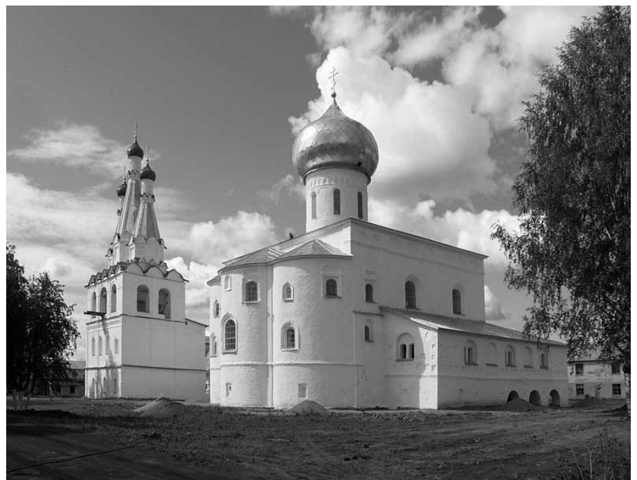
Свято-Троицкий собор Александра Свирского мужского монастыря