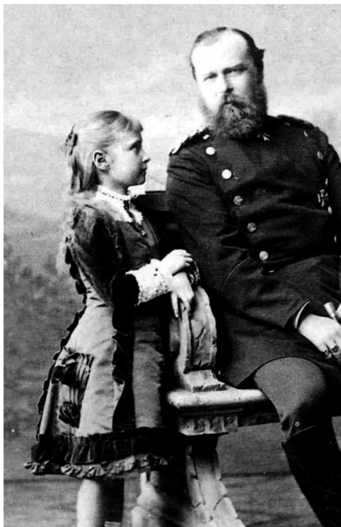
Принцесса Аликс с отцом

Дети российских царей также с ранних лет приучались к исполнению долга и труду. Но в российском высшем обществе в целом праздность отнюдь не считалась пороком. А.Н. Боханов рассказывает, что одним из первых начинаний