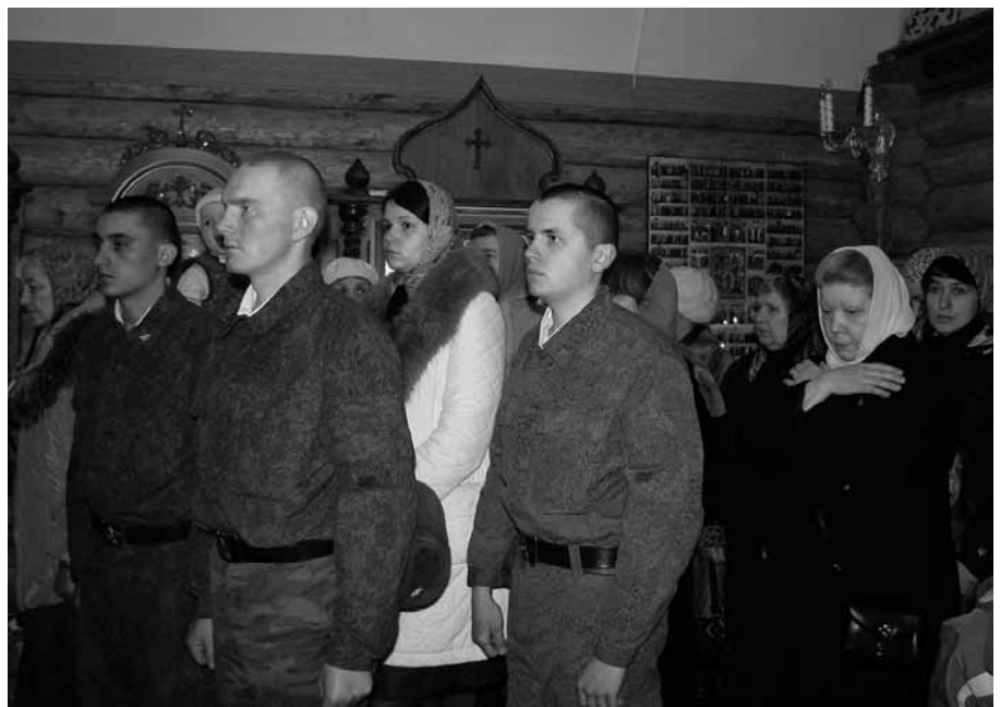
На службе присутствовали офицеры и солдаты в/ч 41427

Обращаясь с приветственным словом к молящимся, Его Высокопреосвященство отметил, что всегда очень радостно освящать новопостроенные церкви и видеть, как они наполняются верующими. «Хотя в Московской епархии сооружено уже более 300 новых храмов, совсем нечасто приходилось освящать храмы в воинских частях. Сегодняшнее событие — особая радость, тем более что святой великомученик Георгий Победоносец уже много веков является небесным покровителем нашего христоролюбивого воинства», — сказал Владыка. Благословляя молящихся,