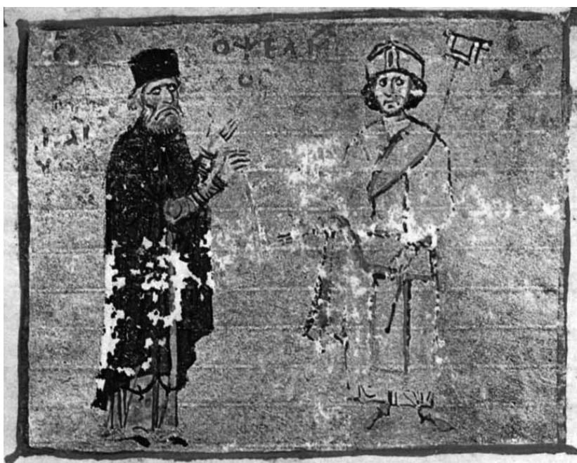
Михаил Пселл со своим учеником, императором Михаилом VII

Не шесть веков, отделяющих нас от времен мудрейшего из царей — Соломона, автора богодухновенных «Притч», «Екклесиаста» и «Песни Песней». Но все новые и новые поколения продолжают читать их и размышлять над ними. «Притчи» поучают нас, а «Екклесиаст» — очищает сердце от расположения к видимому, все преходящее называя суетным. На их фоне «Песнь Песней» — загадочная, ни с чем не сравнимая книга. Что перед нами: свадебный гимн, а может быть драма, где главная тема — чувства влюбленных? А может быть царь и пророк Соломон хотел сказать что-то большее? Возвышенно-таинственное толкование «Песни Песней» помогает нам гораздо глубже проникнуть в ее смысл. Любящие друг друга мужчина и женщина и отношения между ними символически знаменуют то, что относится к миру