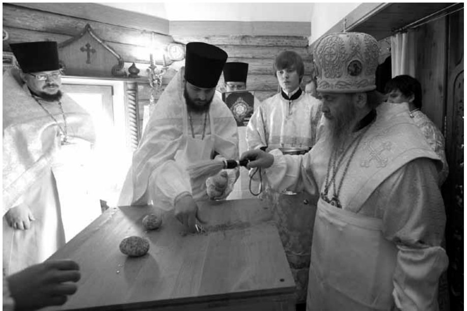
Подготовка к освящению престола

По благословению митрополита Крутицкого и Коломенского Ювеналия совершить великое освящение храма