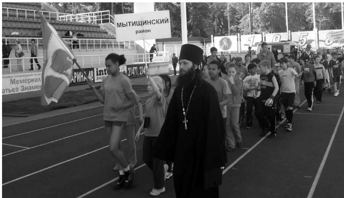
Фестиваль физической и духовной культуры