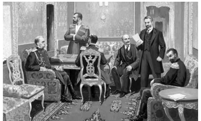
Коваленко И. А. Отречение от престола императора Николая II 2 марта 1917 г. «О провидение, Благословение нам ниспосли!»

Вполне логично допустить, что к моменту принятия последних решений Государь уже зтал, или чувствовал, что «на этот час Он и послан в мир». А потому на предложения «аре-