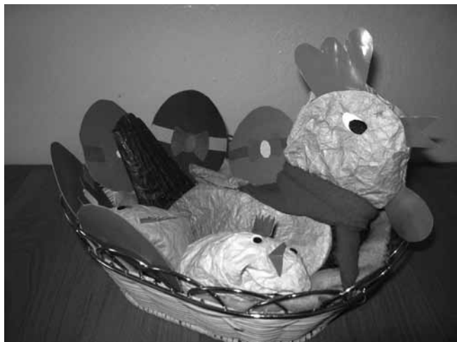
Композиция Курочка и цыплята. Социально-реабилитационный центр "Росинка", г. Ростов