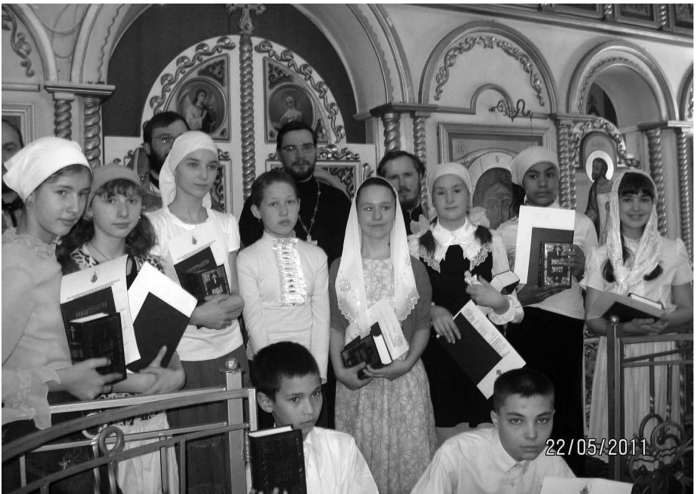
Вручение Евангелия окончившим Воскресную школу

Прочитать подробнее можно здесь: http://www.mepar.ru/news/2011/05/28/10436/