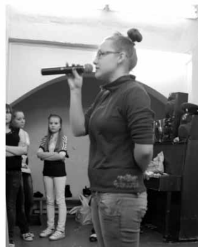
В детском доме-интернате "Березка"