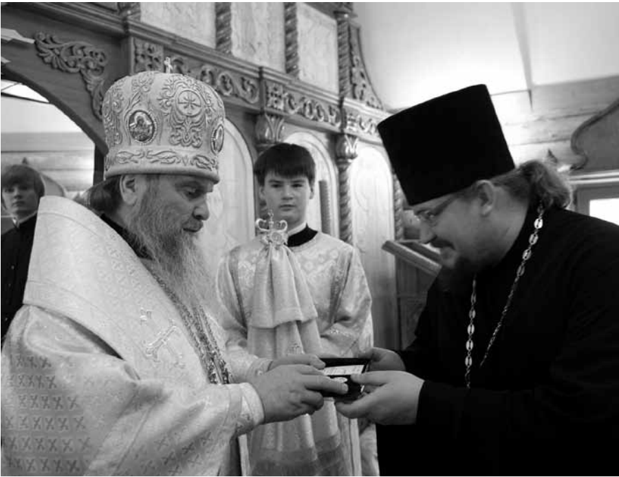
Владыка Григорий вручает настоятелю Донской Церкви Иоанну Осипову епархиальную медаль I степени

архиепископ Григорий призвал небесное заступление великомученика Георгия на командный и рядовой состав части, а также всех прихожан нового храма.