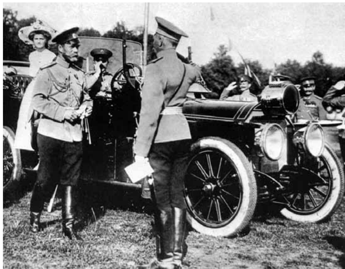
Прибытие императора на военные маневры