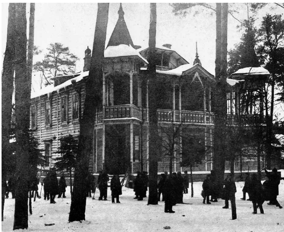
Школа № 5 Северной железной дороги в одной из дач Перловых. 1928 г.

Жители Перловки рыли окопы, противотанковые рвы и строили бомбоубежища на своих участках рядом с домами. Вдоль реки Яузы со стороны сегодняшних Новых Мытищ и у железной дороги были установлены проволочные заграждения, противотанковые ежи, надолбы, доты и дзоты. По воспоминаниям местных жителей, зенитные установки были размещены у рек Ичка и Яуза.