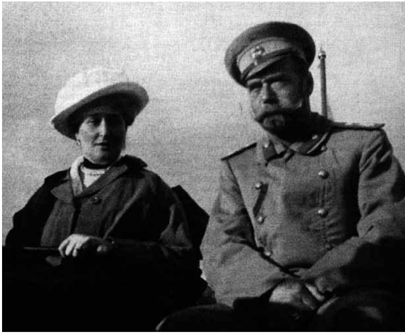
Император Николай II. 1916 г.

В управлении государствами, когда творятся великие события, вожьд нации, кто бы он ни был, осуждается за неудачи и прославляется за успехи. Дело не в том, кто проделывал работу, кто начертывал план борьбы; порицание или хвала за исход довлеют тому, на ком авторитет верховной ответственности. Почему отказывать Николаю II в этом суровом испытании?.. Бремя последних решений