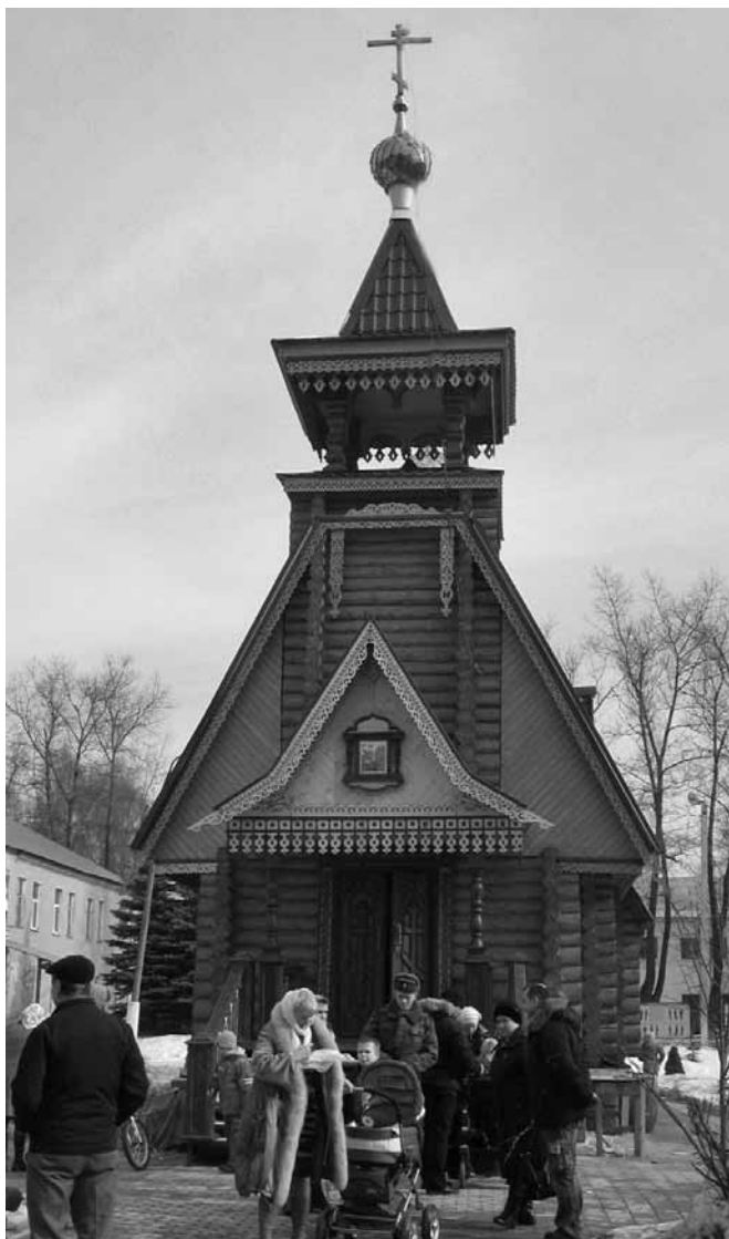
Вербное воскресенье. 2010 год