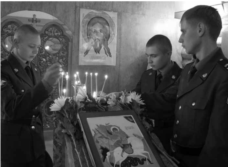
Первая Божественная Литургия. 6 мая 2008 г.

Имя святого Георгия носил основатель Москвы Юрий Долгорукий , создатель многих Георгиевских храмов, строитель города Юрьева-Польского. В 1238 году героическую борьбу русского народа с монгольскими ордами возглавил великий князь Владимирский Юрий (Георгий) Всеволодович , сложивший голову в битве на реке Сити. Память о нем, как о Егории Хра-