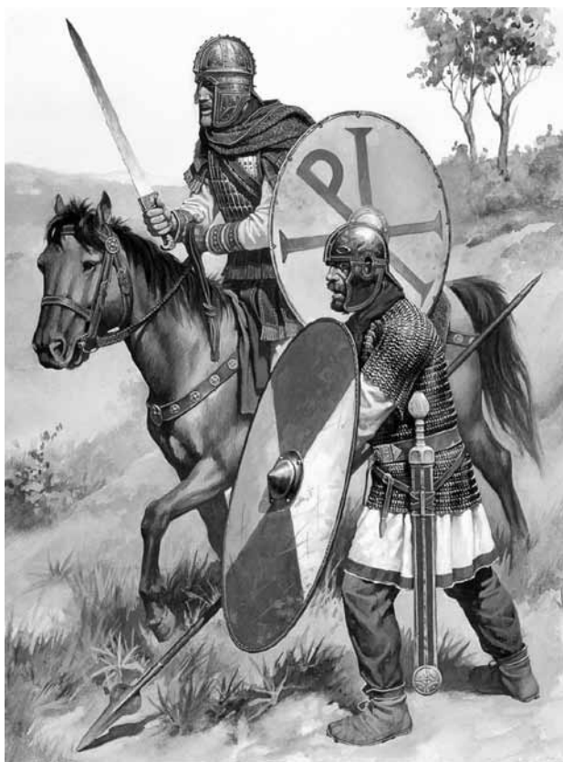
Римские солдаты эпохи Константина. сер. IV в. н. э.

в жизни государственного или военного служащего было наполнено языческими ритуалами. Очевидно, что репрессии в отношении христиан следовали именно после их отказа от участия в подобных церемониях. Подтверждение этому мы можем найти у Квинта Септимия Тертуллиана, выдающегося христианского богослова и писателя конца II — начала III в. В своем сочинении «О венке солдата» («Liber de corona militis») Тертуллиан подробно описывает случай, произошедший в 211 г. В связи с воцарением новых императоров Каракаллы и Геты солдатам римской армии были розданы подарки. Получить их воины должны были, имея на головах лавровые венки. Однако один из солдат подошел за подарком, неся венок не на голове, а в руке. Будучи спрошен о причинах своего поведения, он ответил, что является христианином. В венке же, по-видимому, воин увидел языческий символ. Солдата привели для объяснений к префекту, где он подтвердил, что верует