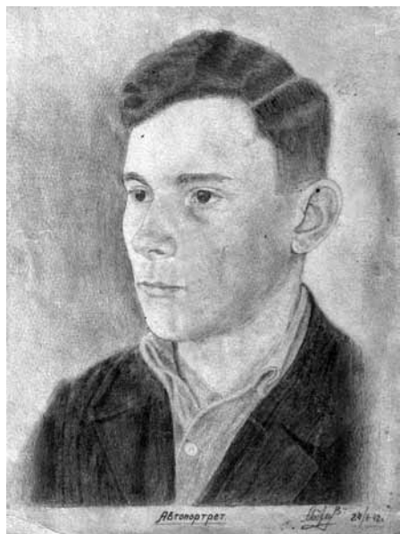
Автопортрет. 1942 г.

СУДЬБА НАШЕГО ЗЕМЛЯКА, ПОГИБШЕГО В 1944 Г.