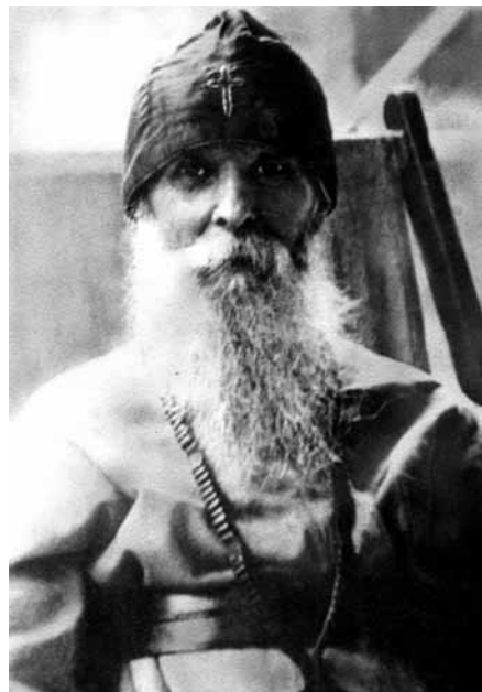
Иеросхимонах Серафим Вырицкий

Подошел главный, посмотрел и сказал: «Все». Мы хотели уходить, но солдат вдруг открыл глаза и отчетливо сказал, смотря на меня: «Я умираю, рана смертельна, достаньте крест, он в верхнем