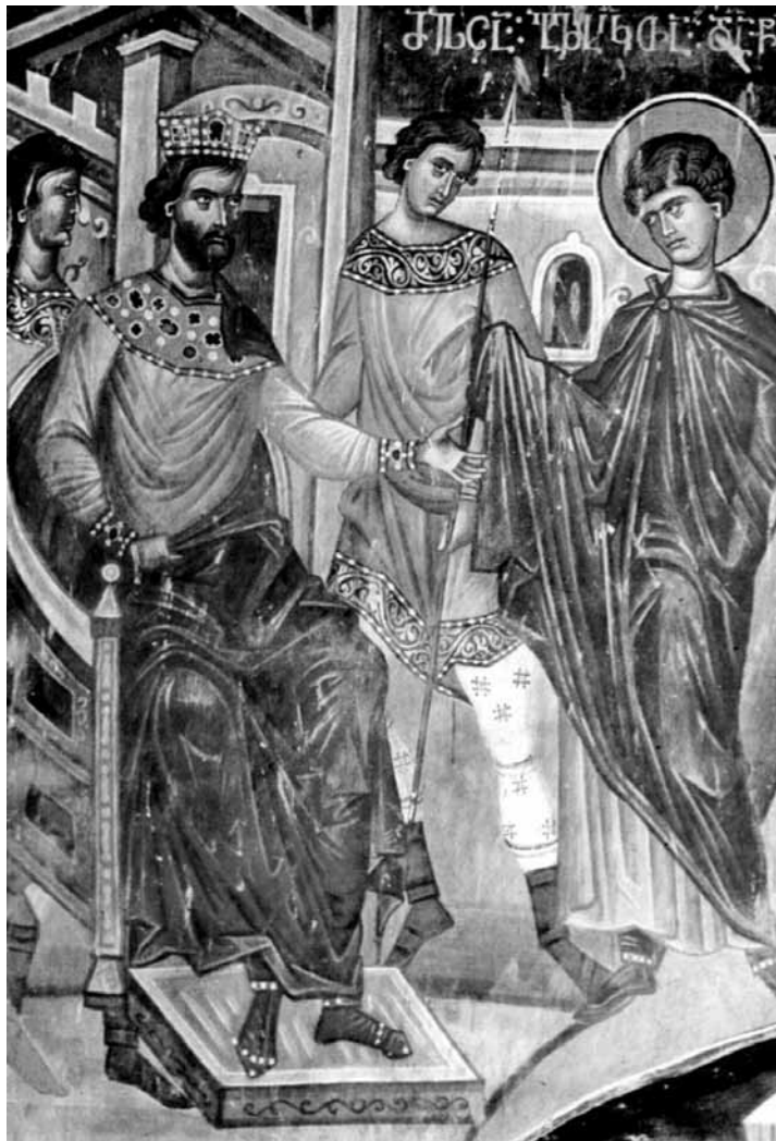
Св. Георгий перед Диоклетианом. XIV в. Фреска из Георгиевского монастыря в с. Уссиси, Грузия.

Поздравляю с праздником, прежде всего наших воинов, потому что это,