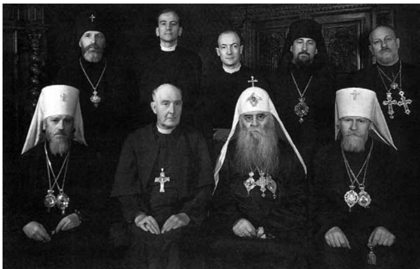
Визит архиепископа Йоркского в СССР. На фото в 1 ряду (слева направо): митрополит Алексий (Симанский), архиепископ Йоркский С.Ф. Гарбетт, Патриарх Московский и всея Руси Сергей, митрополит Николай (Ярушевич)

С августа 1941 г. в прессе стали появляться публикации о патриотической деятельности Русской Православной Церкви. Несмотря на осадное положение в Москве, на Пасху 1942 г. было разрешено беспрепятственное движение верующих всю ночь с 4 на 5 апреля. В ноябре 1942 г. митрополит Николай (Ярушевич) назначается членом Чрезвычайной государственной комиссии по установлению и расследованию злодеяний немецко-фашистских захватчиков и пред-