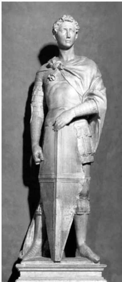
Донателло. Святой Георгий

Естественно, за такой поступок Георгию грозили пытки и смерть. Согласно римскому закону, Георгий, как римский гражданин и высокопоставленный военачальник, предстал перед императором, который приговорил его к множественным пыткам, которые, по разумению Диоклетиана, заставили бы его отказаться от своих убеждений. Но великомученик проявил стойкость и даже проповедовал Христа во время пыток. Согласно некоторым легендам, в конце мучений Георгия, император Диоклетиан, лично спустившись в темницу, еще раз предложил истерзанному пытками бывшему комиту отречься от Христа в обмен на повышение по службе и почести. Когда же попытки императора не увенчались успехом, Георгий был приговорен к смерти — ему отрубили голову. Произошло это в 303 или 304 г. в Никомидии, а вскоре тело великому-