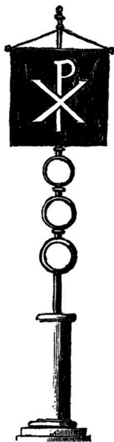
Римский Лабарум-штандарт Константина Великого с изображением монограммы Христа

ского мира» с учетом новых реалий возникает понятие «симфонии», — союза государства и Церкви в деле защиты христианской веры и государственного устройства империи. Одним из важнейших элементов симфонии является «христолюбивое воинство», оберегающее империю от варваров-иноверцев или еретиков, которому по воле Божьей дается победа над врагами правоверного государства. Идеи раннехристианских богословов о недопустимости или нежелательности быть воином и христианином одновременно ушли в прошлое в условиях изменившихся реалий. И действительно, сложно себе представить отлучение от причастия христианских воинов в эпоху, когда роль армии в защите отечества была чрезмерно важной. Например, перед лицом языческой Персии или исламского Халифата. Оформившись в Византии, идея симфонии вместе с православной верой пришла и на Русь, где получила свое развитие. Великие князья и цари вели войска в бой под знаменем Спаса, а святители и преподобные благословляли русское христианское войско на бой ради защиты отечества от иноверцев. И даже в советское время, когда, казалось бы, вернулись реалии гонений первых веков христианства, перед лицом страшного врага в годы Великой отечественной войны Церковь призывала верующих встать на защиту родной земли. Для верующего христианина в Великую Отечественную войну, как и для древних римлян, победы своего отечества стали личными победами, ведь, несмотря на временные гонения, судьба России в церковном сознании всегда связывалась с православным христианством.