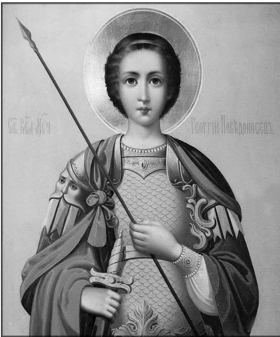
Св. Вмч. Георгий Победоносец, Афронская икона. XIX в.