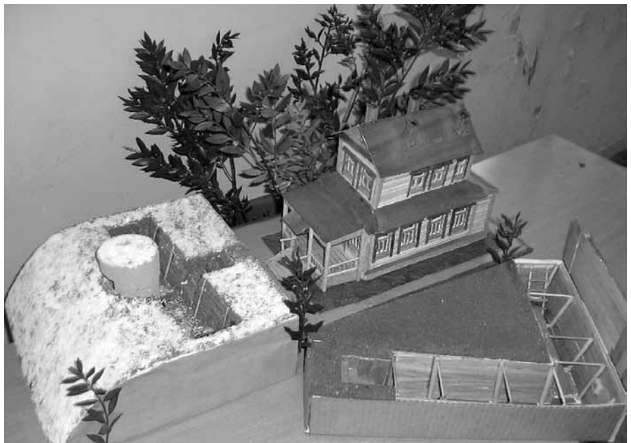
Макет дома, здания начальной школы № 7 и домашнего бамбубежища. Реконструкция М.П. Бахметова

Материал предоставлен историком-краеведом О. И. Вороновой