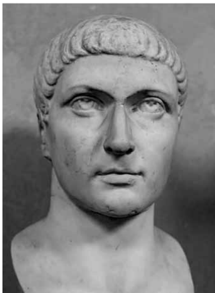
Император Константин Великий. Прижизненная скульптура. IV век

Изменение положения Церкви при Константине привело христианских богословов к официальному признанию того факта, что император, восстановив «Римский мир», сделал возможной проповедь Евангелия среди всех народов империи. Более того, в победе Константина над Максенцием христианские богословы увидели прямое вмешательство Божие, благоволение к христианскому императору на поле боя. В торжественной речи, посвященной Константину, Евсевий Кесарийский утверждает, что, водрузив на военные штандарты образ Креста , немеркнущий и спасительный, как знак «защиты Римской империи и царства вселенной», император одержал сразу две победы, над врагами и демонами. Подобные взгляды мы находим и у св. Амвросия Медиоланского, который первым среди отцов Церкви высказал идею о «справедливой войне». Непримируемый борец против язычников, решительный и волевой церковный организатор, миланский епископ Амвросий до того, как стать епископом, был высокопоставленным военным. Вслед за св. Амвросием Блаженный Августин, видный богослов V столетия, поддержав теорию «справедливой войны», наиболее полно раскрывает ее. Основа представленный Августина о войне и мире — идея непреходящей греховности человеческой природы. Мир — это идеал, недостижимый в земном, человеческом царстве, и греховность людей будет всегда вызывать