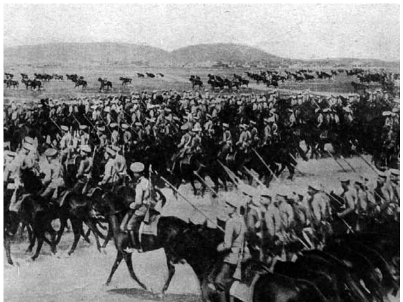
Развертывание русской кавалерии. Первая мировая война