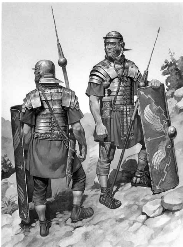
Римские солдаты. I-II вв. н.э.

И это не случайно. Читая труды некоторых отцов, так или иначе затрагивающих этот вопрос, наталкиваешься на мысль, что принятие или неприятие войны как явления зачастую основано на слишком идеалистическом восприятии христианства. И это восприятие иногда коренным образом расходится с реальной жизнью христианских общин того времени, состоявших в том числе и из профессиональных воинов. Так у св. Иустина Философа, жившего во II веке, в его Диалоге с Трифоном Иудеем, мы находим мысли, свидетельствующие о крайних пацифистских взглядах некоторых христианских богословов того времени: «Каждый из нас прежде был одержим войною, убийством и нечестием всякого рода, но мы переменили воинские орудия на земле: мечи на орала, копы на земледельческие орудия — теперь мы возделываем благочестие, праведность, человеколюбие, веру, надежду». Подобного рода мысли, выраженные в неприятии даже самой мысли о воинском служении для христианина, мы находим и в одном из древнейших христианских текстов, «Апостольских преданиях», приписываемых другому раннехристианскому святому — Ипполиту Римскому (III в.): «Оглашаемый или христианин, желающий стать воинами, да будут отвержены, потому что они презрели Бога». Впрочем, эта мысль более полно раскрывается в Канонах Ипполита Римского, где в 13 каноне в качестве