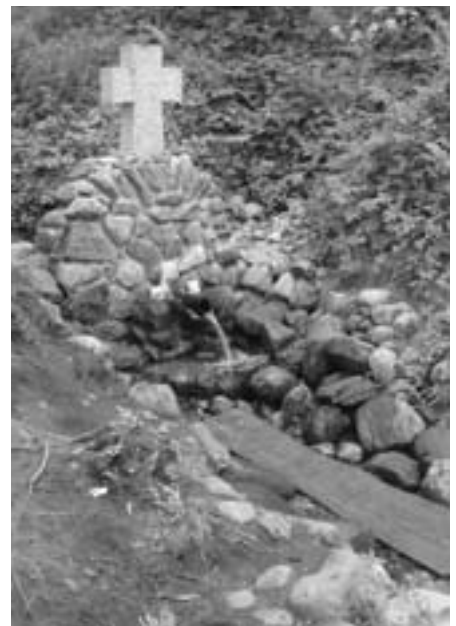
Св. источник Тихвинской иконы Божьей Матери

Трагические события «литовского разорения», события смутного времени,