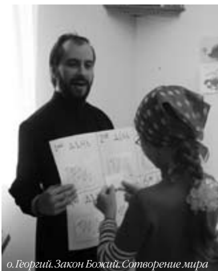
о. Георгий. Закон Божий. Сотворение мира