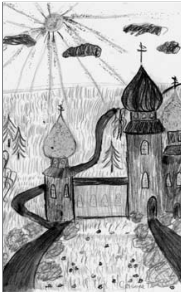
Тропинка к храму. Сенина Тамара