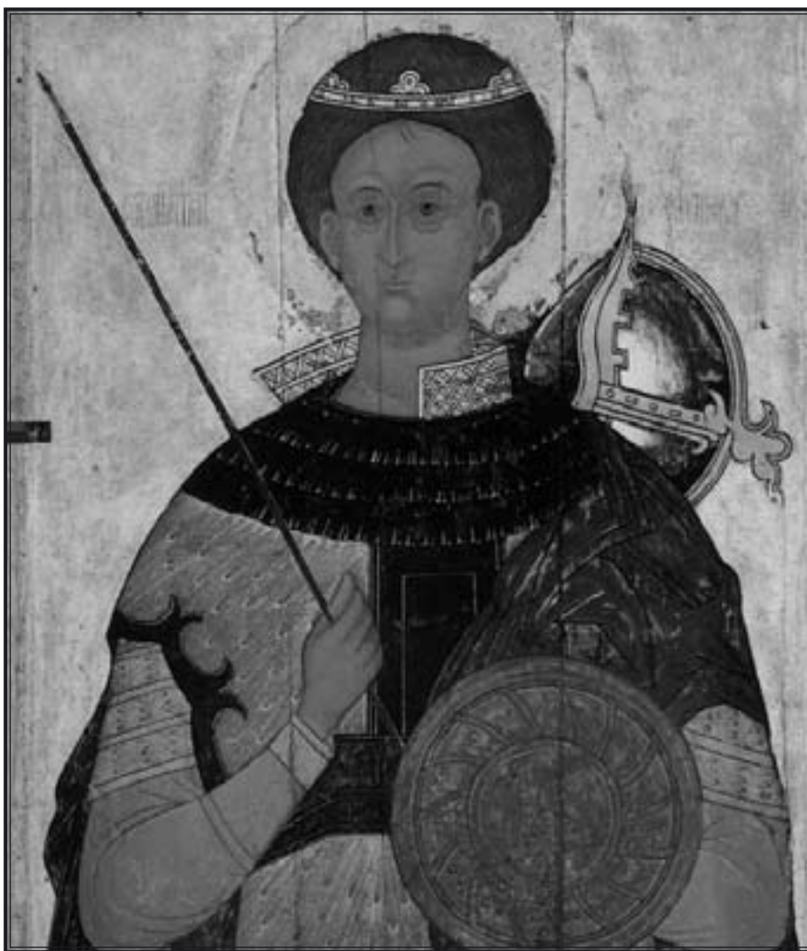
Великомученик Дмитрий Солунский. Московская школа. 1580-е г.