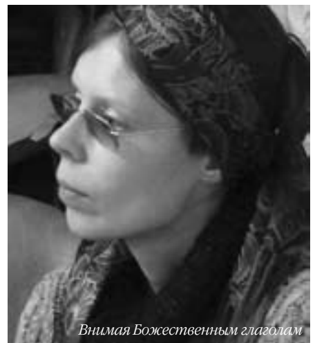
Внимая Божественным глаголам