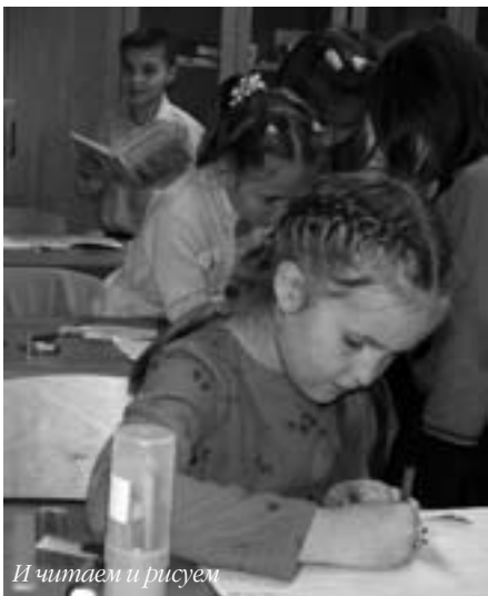
И читаем и рисуем