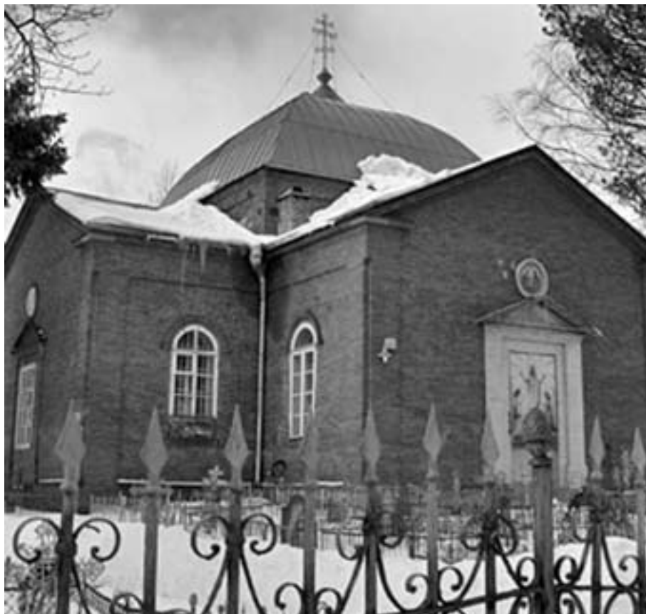
Храм Петра и Павла

В период Великой Отечественной войны церковь была закрыта. Здание сначала использовали как красильный цех, а в 1943 году в нем разместили военный телеграф. Иконостас и церковные ценности (иконы и утварь) были утрачены. По рассказам старожилов,