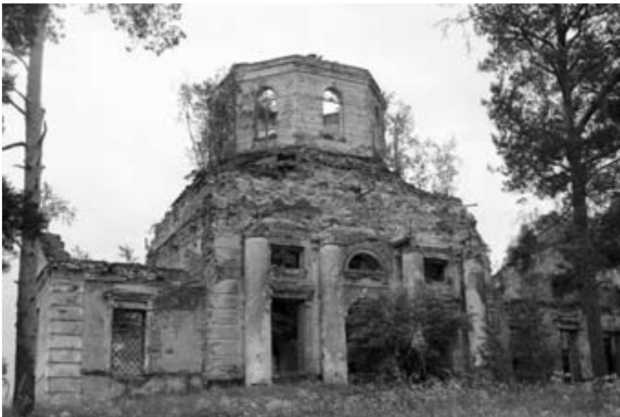
Церковь Покрова Пресвятой Богородицы