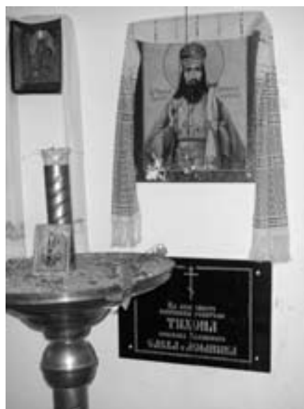
В часовне Тихона Задонского

Святыней Покровской церкви была чудотворная икона Покрова Пресвятой Богородицы, оставшаяся от Покровского монастыря. Вблизи этой иконы находилась другая — св. великомученицы Параскевы Пятницы. Портрет св. Тихона, присланный в Короцкую церковь из Задонского монастыря в 1852 году, висел на окне за престолом. Рядом с церковью с незапамятных времен существовало кладбище. На кладбище можно увидеть фрагменты древнерусского жальника и могилу родителей Тихона Задонского (Саввы и Домники) с возведенной над ней в 2004 году часовней. До этого в 1892 году здесь была выстроена на личные средства настоятельницы женского монастыря в Короцко часовня, но до настоящего времени она не сохранилась.