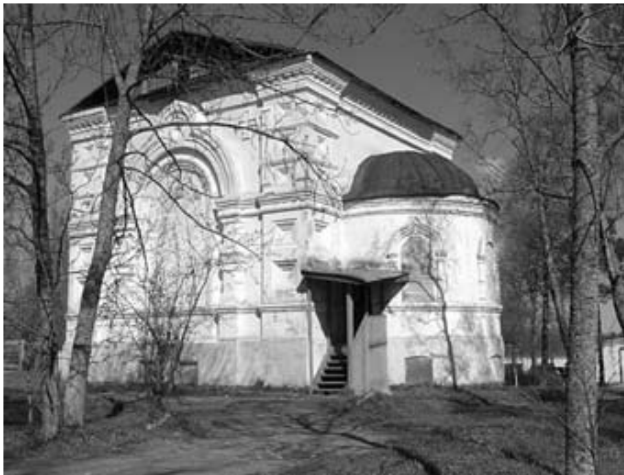
Короцко. Женский монастырь

здесь была колония для беспризорников, затем сельскохозяйственный техникум, а с 1937 года — психоневрологическая больница, работающая и в настоящее время. Внешний вид зданий полностью изменился: исчезли колокольни, купола церквей, неузнаваемо перестроен Владимирский Собор, разделен на два этажа храм всех святых, закрашена вся настенная живопись обеих церквей. Осталась только церковь (достаточно сохранившаяся) во имя великомученицы Варвары и всех святых.