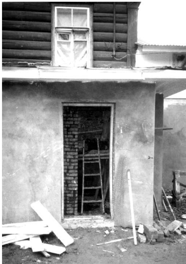
Начали осваивать цокольный этаж

ки масштабов не ощущают, но знают, как положено для службы, а я, наоборот, масштабы ощущаю, но в то время не знал храмовой функции. Тут сказались и отсутствие у меня опыта строительства храма, я не мог предусмотреть всех архитектурно-строительных нюансов: алтарь получился маленький, западная часть плохо развита, не акцентирован главный вход. Это была моя ошибка. Сказались непонимание церковных законов, канонов.