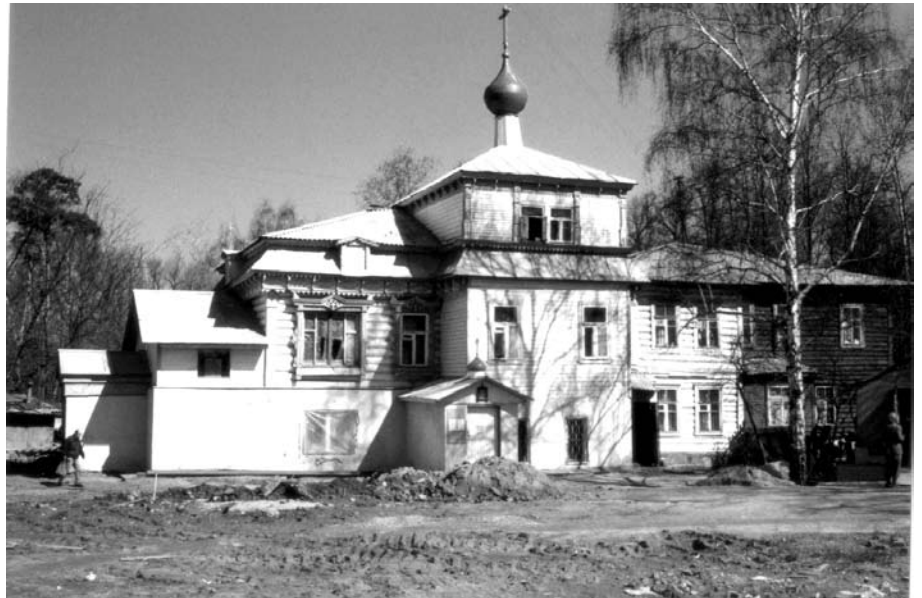
Церковь до пожара