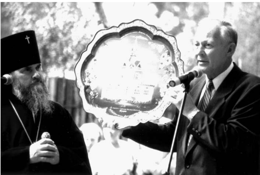
На освящении закладного камня

Палаточка наша уцелела. Сильно обгорела береза — пламя поднималось выше нее. Ее потом хотели спилить, но потом оставили как память.