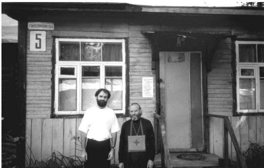
Дом на 1-м Ярославском