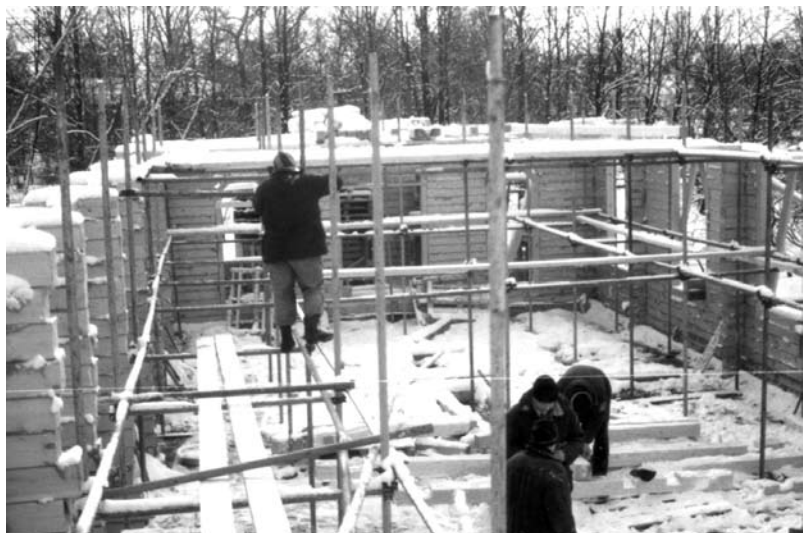
И застала стройка