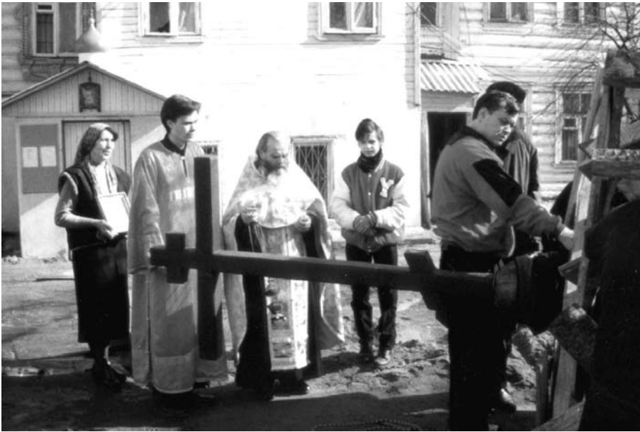
Молебен перед поднятием крестов