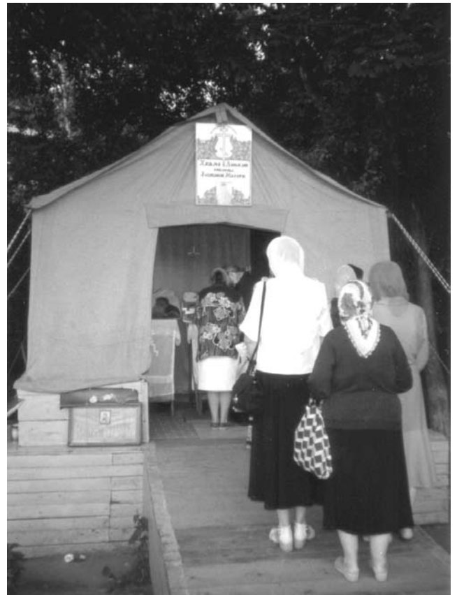
Служба в палатке

Нас батюшка вразумлял: «Не телесный запах замечайте, а тот душевный за-