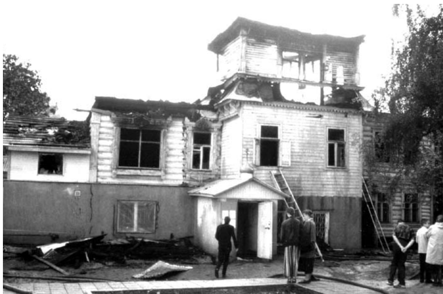
и после пожара

Возрождение храма — символ и нашего возрождения, потому что приход к святости, к духовной высоте, к чистоте и красоте, к благолепию идет через путь внутреннего самоочищения, внутрен-