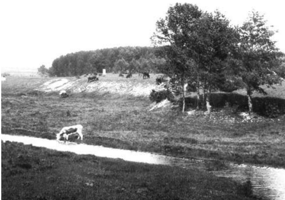
Старая Перловка.