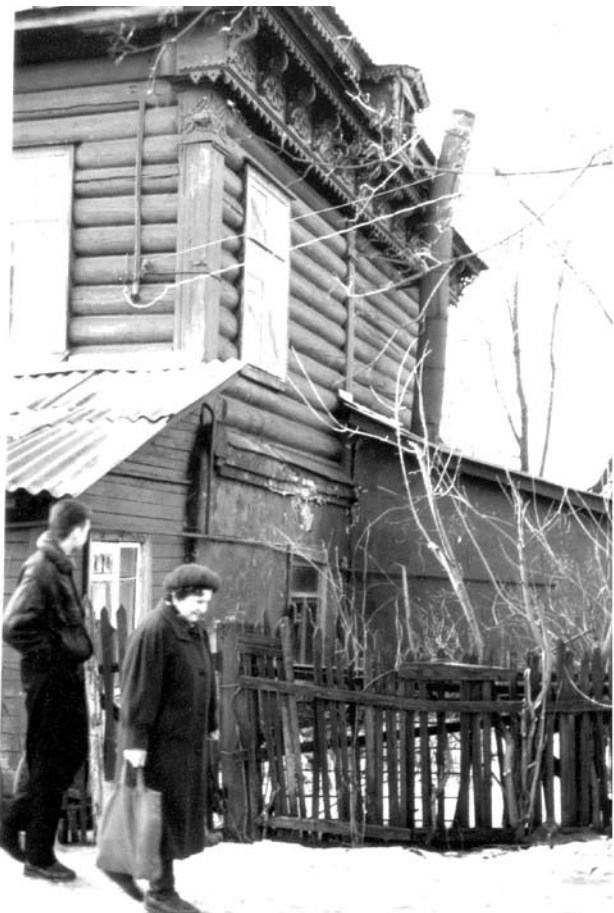
Тот самый дом