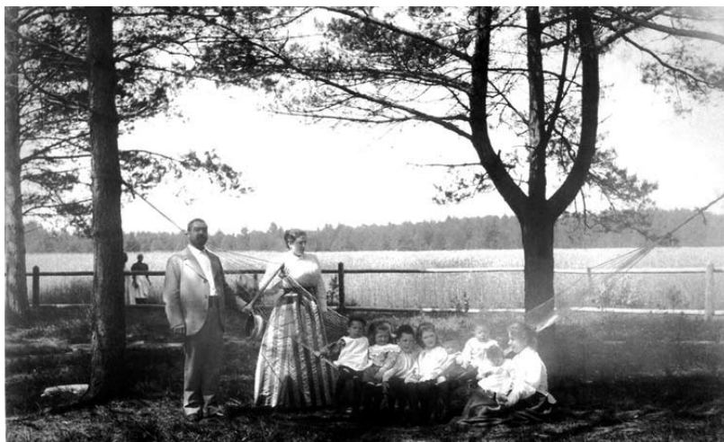
Дачники. Конец XIX века.

Заметьте, я рассказываю о мощных каменных церквях, построенных на рубеже XVIII — XIX веков. Такую кладку трудно разрушить, вот и использовали оскверненные церкви под склады, клубы, школы, госпитали, госучреждения и прочее и прочее... Они ветшали, разрушались, оседали сторбленными стари-