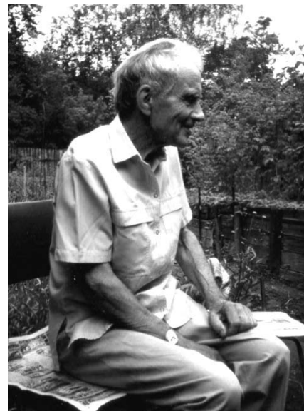
Последний алтарник Донской церкви