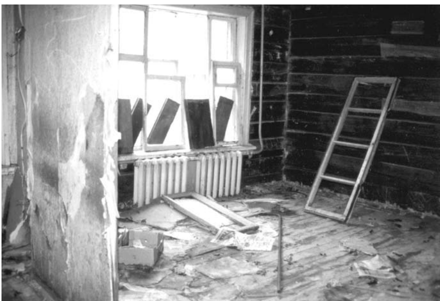
Внутри дома №32