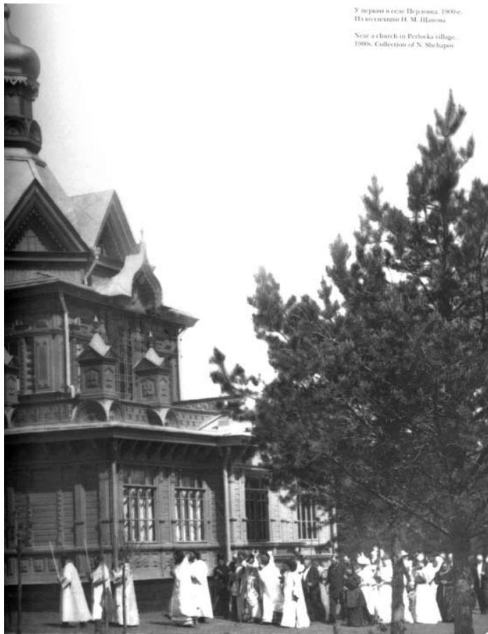
У церкви в селе Перловка. 1900-е. Near a church in Perlova village. 1900s.

Строительным отделением Московского Губернского правления уже в следующем году и начал, вероятно, осуществляться строительный план, а в 1896 году он был закончен. Во всяком случае, путеводитель 1897 года сообщал: