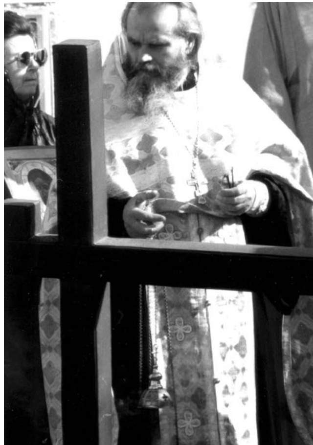
К поднятию купола все готово,

ла сверху, из окошка. Но с годами стала тише. Мы считали ее хитрой, как лиса.