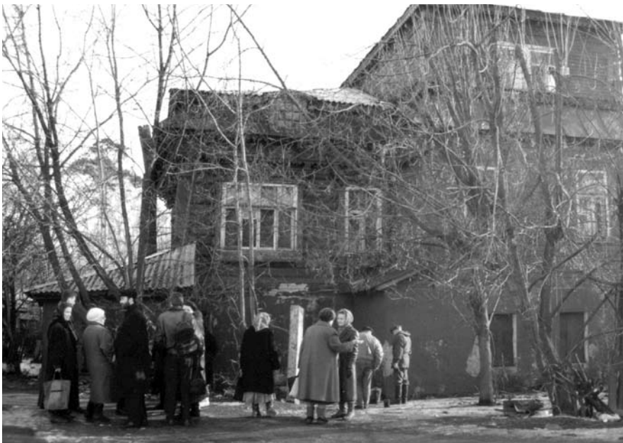
Здесь будет храм