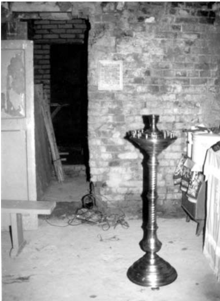
В таких условиях шли службы