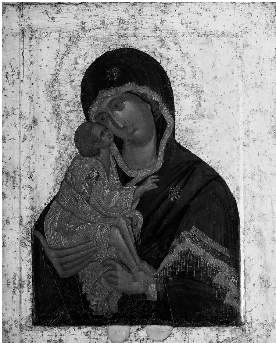
Богоматерь Донская. 90-е годы XIV в.

Общероссийское почитание Донской иконы Божией Матери связано с реальными историческими событиями. В царствование Ивана IV Васильевича начался очередной этап борьбы с “неверными агарянами” — Казанским, Астраханским и Крымским ханствами, остатками Золотой Орды. Два похода, совершенные Иваном Васильевичем на Казань не принесли успеха. Подготавливая новый, 1552 г., поход, вспомнили о событиях конца XIV в., когда московский князь Дмитрий Иванович разбил на Куликовом поле воинство Мамаю. Для русских людей XVI в. как бы вновь повторялись события давно минувших дней. Много было пролито слез и совершено молитв перед Донским образом Божией Матери, когда битва с крымскими татарами происходила на подступах к самой Москве. Было это в 1591 году. Крымский царевич Нурадин и его брат Мурат-Гирей с многочисленным войском вторглись в Россию, и, подступив к Москве, расположились на Воробьевых горах. Для ограждения от врагов вокруг Москвы был совершен крестный ход с Донской иконой Пресвятой Богородицы. В день битвы она находилась в походной церкви среди воинских рядов. Татары были обращены в бегство. В благодарность Пресвятой Богородице за Ее милость, явленную через Донскую икону, в 1592 году на том месте, где она стояла среди воинов, был основан Донской