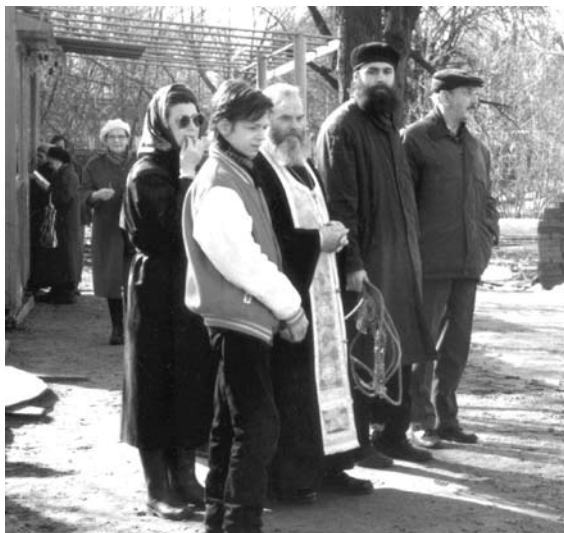
Скоро поднимут купол

Прежде у меня даже мечты такой не было — храм строить, но Господь привел к такому делу. Работа двигалась, и я каждый раз с трепетом ждал, когда же поеду в церковь. Может это и нехорошо, но я не раз за собой замечал, что в храм ходил не на службу, а на авторский надзор.