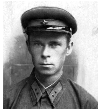
Отец. Фото накануне войны

И во время войны, и после нее мама работала сварщицей на заводе, она всегда была в числе лучших, ей поручали самую ответственную работу. Она зарабатывала столько, что я не ощущала послевоенного голода. Но знаю, что девочки по соседству жили очень скудно.