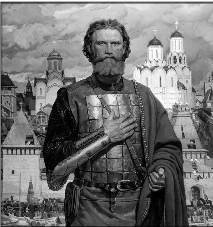
Художник В. Маторин. Святой благоверный великий Московский князь Дмитрий Донской