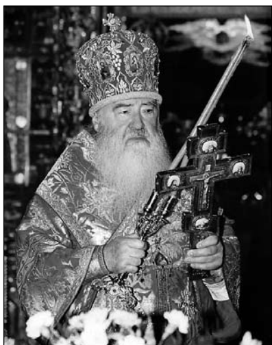
митрополита Крутицкого и Коломенского ЮВЕНАЛИЯ

священнослужителям, монашествующим и мирянам, всем верным чадам Русской Православной Церкви Московской епархии