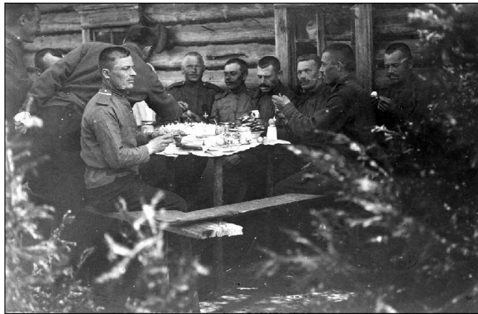
Празднование Пасхи в 1916 году

Как будто тяжесть какая свалилась с души, когда нашел я это место. Конечно, литургии служить нельзя: слишком грязно и тесно, но мы постараемся облагоденствовать насколько возможно и хоть светлую заутреню отслужим не в темноте. Работа закипела, а я побежал в свою фанзу: надо ведь устраивать и у себя пасхальный стол для всех нас. Стол, довольно длинный, мне раздобыли; скатертью обычно служат у нас газеты, но нельзя же так оставить и на Пасху; я достал чистую свою простыню и постлал ее на стол. Затем в середине положил черный хлеб, присланный нам из 6-го эскадрона, прилепил к нему восковую свечу — это наша пасха. Рядом положил 10 красных яиц, копченую колбаску,