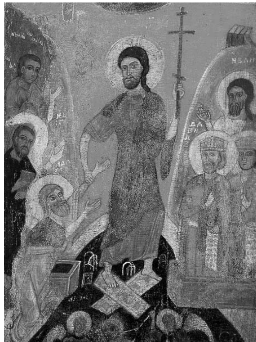
«Сошествие во ад». Новгород. Вторая половина XIII века.

Поэтому иконописец, задача которого — передать пасхальный опыт Церкви — не может просто представить саму сценку исхожденья Спасителя из гроба. Иконописцу необходимо связать Воскресение Христа со спасением людей. Поэтому пасхальная тематика и находит свое выражение именно в изображении сошествия во ад.