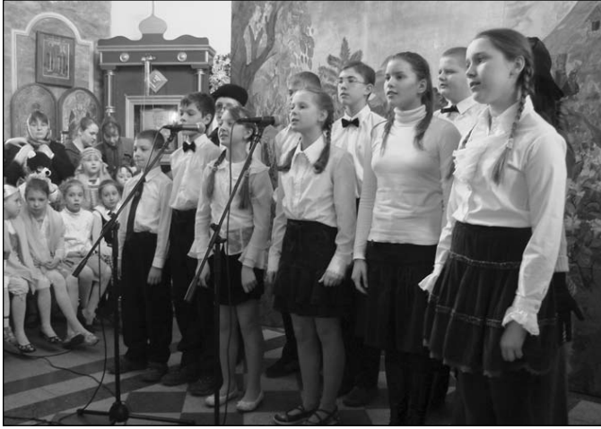
Воспитанники воскресной школы храма Петра и Павла

ПАСХАЛЬНЫЕ КОНЦЕРТЫ В ХИМКИНСКОМ БЛАГОЧИНИИ