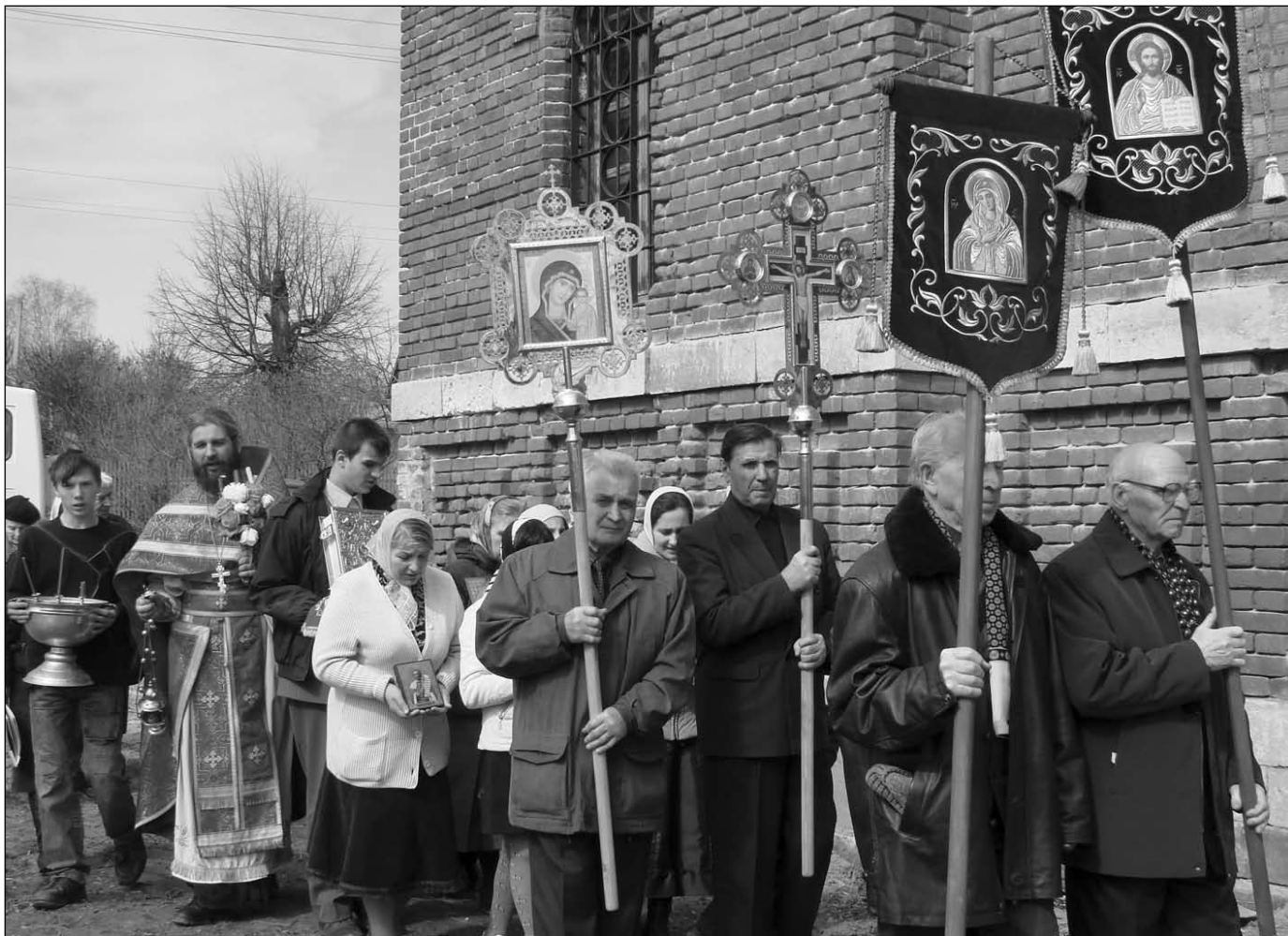
Ветераны в храме вмч. Феодора Стратилата на Светлой Седмице

ветеранов и делают там ремонт для тех, кто в этом нуждается. На средства прихода закупается материал. Ребята работают вместе с прихожанами. Было отремонтировано уже несколько квартир. Ребята почувствовали, что они кому-то нужны, и это очень важно в любом деле, для любого человека. Ветераны войны тоже очень были довольны, что им оказано не просто словесное внимание, но еще и какая-то помощь. Все-таки сделать ремонт пожилому человеку очень трудно, а нанять кого-то даже обоим поклеить — это очень дорого.