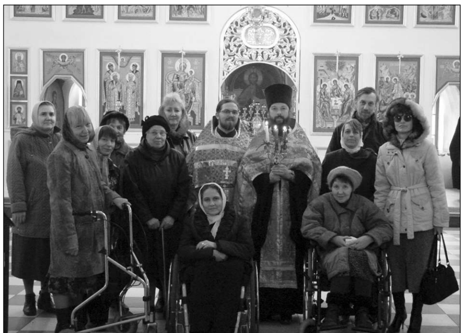
Инвалиды в храме Троицы на Репне