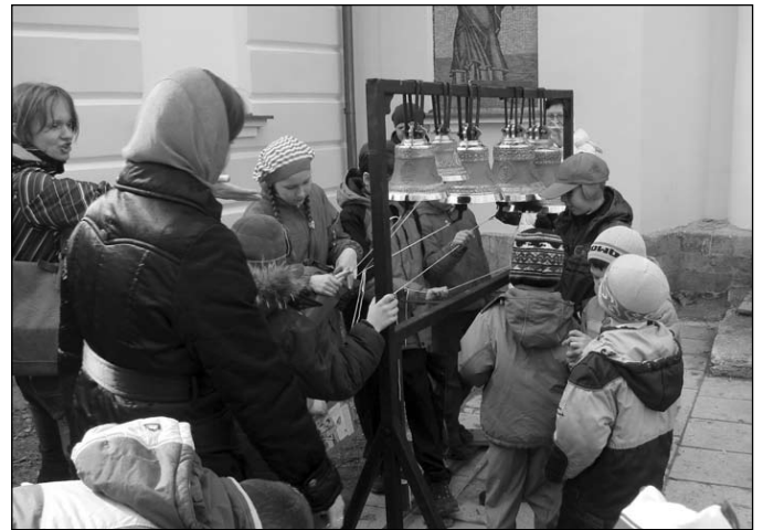
Колокольный звон для гостей из приюта