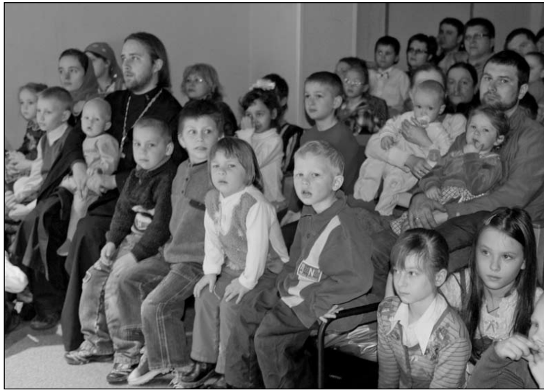
Концерт в Лобне

В понедельник Светлой седмицы воспитанники воскресной школы Петропавловского храма г. Химки поздравляли обитателей центра дневного пребывания г. Химки. Концерт юных дарований порадовал пенсионеров.