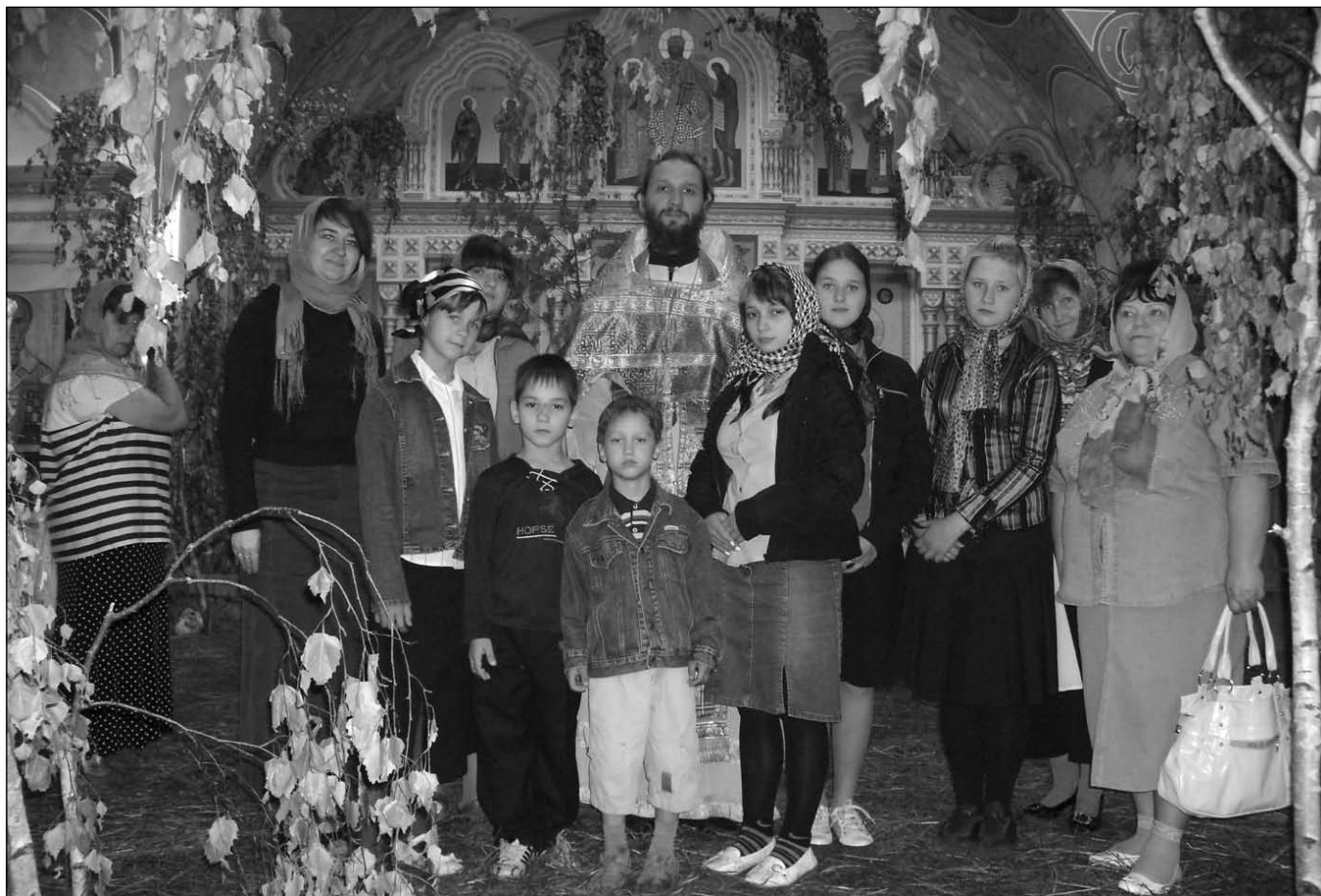
Дети из детского приюта мкр. «Елочки» в Смоленском храме