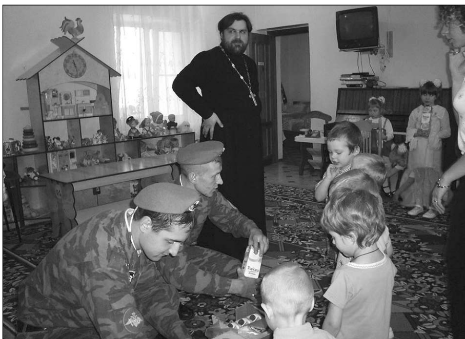
Воины-десантники в детском реабилитационном центре в п. Пески