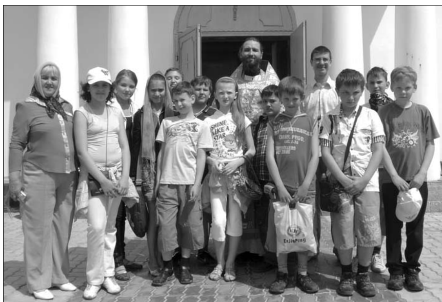
Юные краеведы в Смоленском храме с. Константиново

домодедовского социального центра «Семья» . Группе детей и воспитателей было кратко рассказано об истории храма и смысле сюжетов настенной росписи.