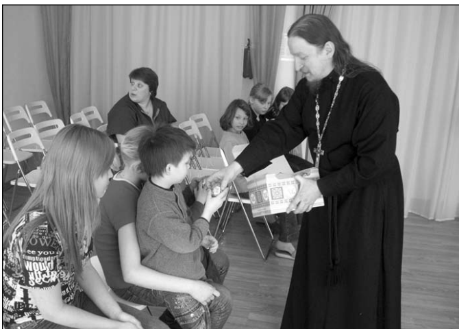
Пасхальные подарки в приюте г.Лобни