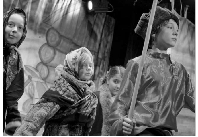
Воспитанники гимназии г.Лобня