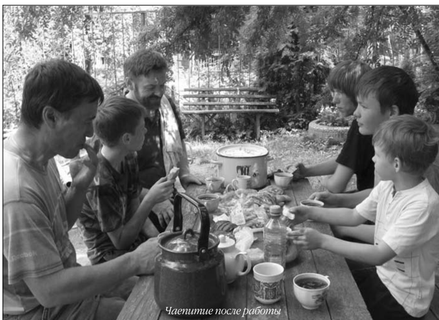
Чашечка после работы