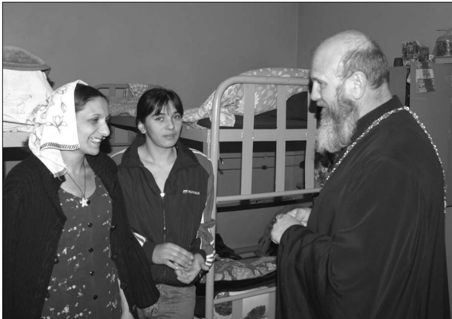
Пасхальная весть в серпуховской тюрьме

Пасхальное торжество на Серпуховской земле в храмах города и района встречало не менее 6.000 человек в 18 храмах. По сложившейся традиции в пасхальное утро духовенство благочиния посетило местную тюрьму, больницы города и района, детские дома. Также пасхальная радость была передана детьми на празднике, прошедшем в Спасском храме г. Серпухова. На пасхальной вечерне вместе со взрослым хором звучали голоса воспитанников воскресной школы. Затем дети показали сказку «Забудь себя» и посмотрели выступление гостей — ребят из православного краеведческого клуба «Трилистник» при Богоявленском храме, которые привезли вертепное действо «Сон первосвященника». «Трилистник» выступил с вертепом в Центральном выставочном зале, детском приюте в Пущине-на-Наре, где также провели товарищеский футбольный матч.